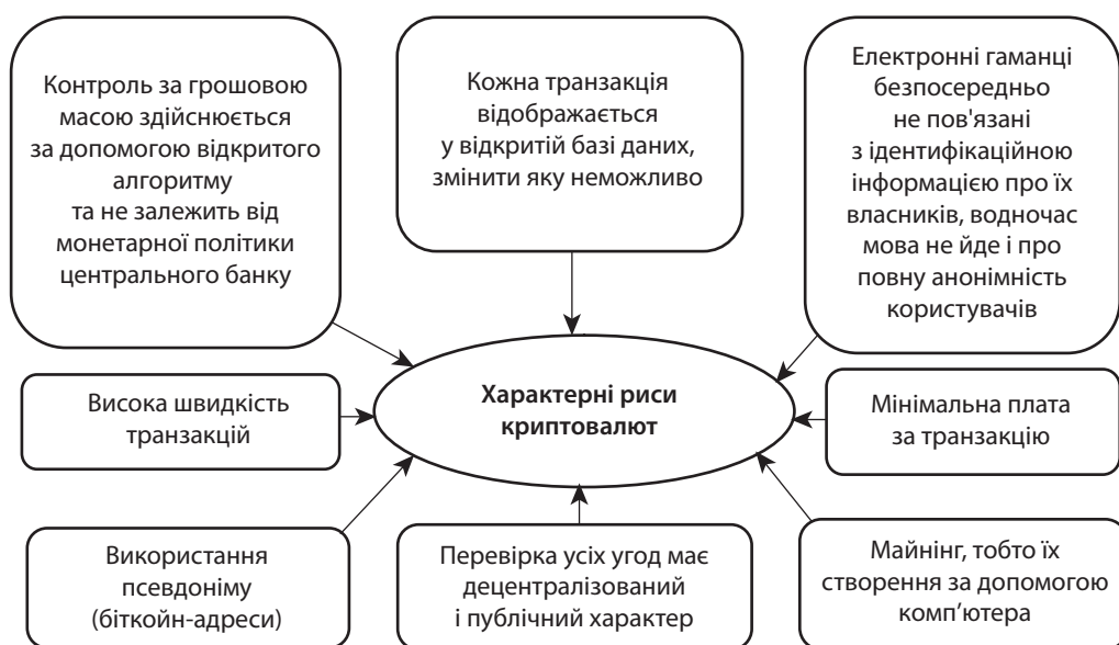
Рис. 1. Характерні риси криптовалют

Ще одна країна – Південна Корея – заявила про намір легалізувати криптовалюту.