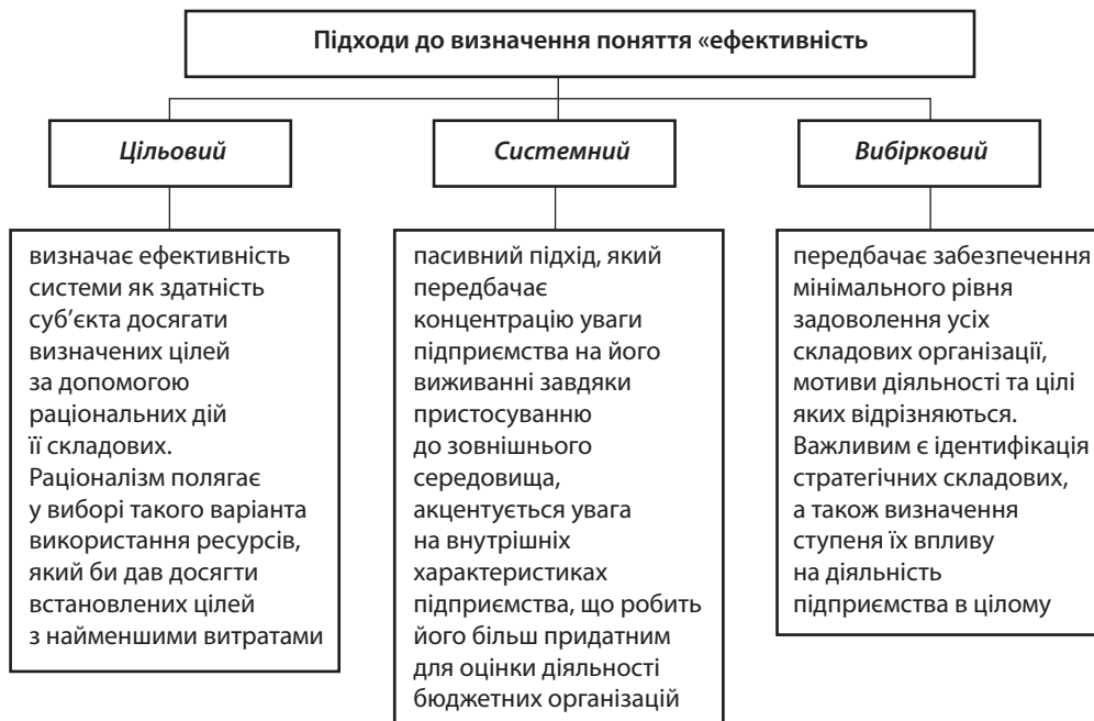
Рис. 2. Підходи до визначення поняття «ефективність» в теорії управління [12]

«ефективність» як співвідношення «результат – витрати». Наведені в роботі [13] точки зору щодо визначення сутності кожного з напрямів представлено в табл. 2 .