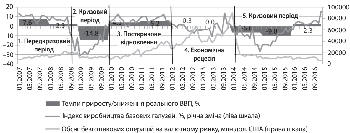
Рис. 2. Періодизація функціонування міжбанківського валютного ринку України відповідно до рівня економічної активності, 2007–2016 рр.