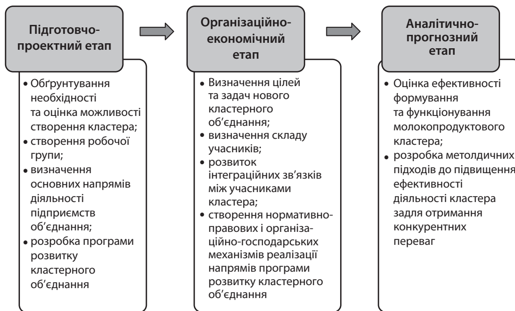
Рис. 1. Етапи створення молокопродуктового кластера

Особлива увага також приділяється наявності наукових та освітніх закладів, що дозволить забезпечити