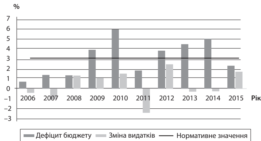
Рис. 1. Взаємозв'язок зміни показника питомої ваги видатків державного бюджету до минулого року та частки дефіциту державного бюджету у валовому внутрішньому продукті

На стадії формування державного бюджету показник обсягу дефіциту розраховується виходячи із прогноз-