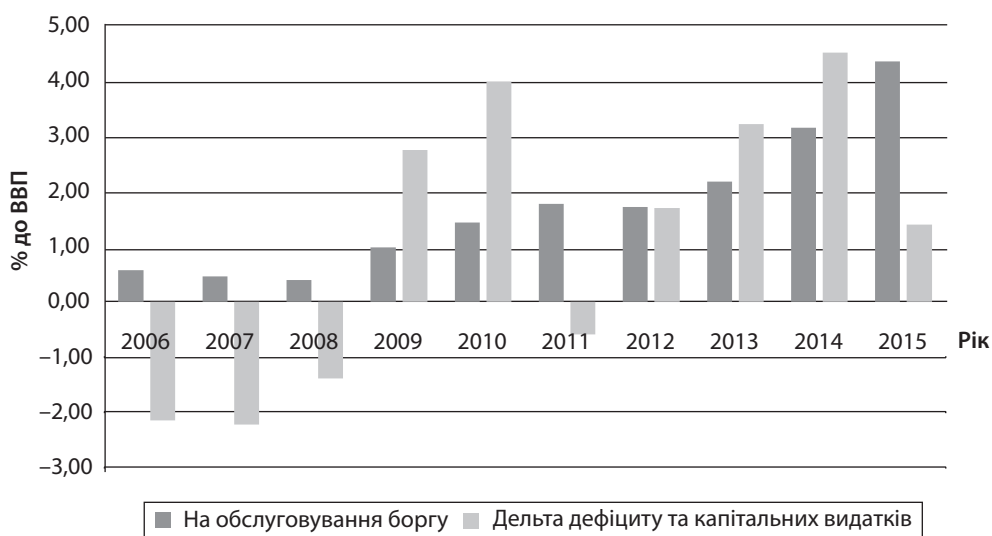
Рис. 3. Частка видатків на обслуговування державного боргу та показника дефіциту, який спрямовується на фінансування поточних видатків у валовому внутрішньому продукті

і у 2009 р., і у 2014 р. реалізувати зазначене вдалося за рахунок кредитного фінансування з боку Міжнародного валютного фонду, яке надається виключно за умови структурних перетворень системи державних фінансів, їх оздоровлення, підвищення дієвості інституційної моделі публічного управління.