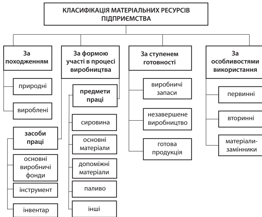
Рис. 1. Класифікація матеріальних ресурсів підприємства