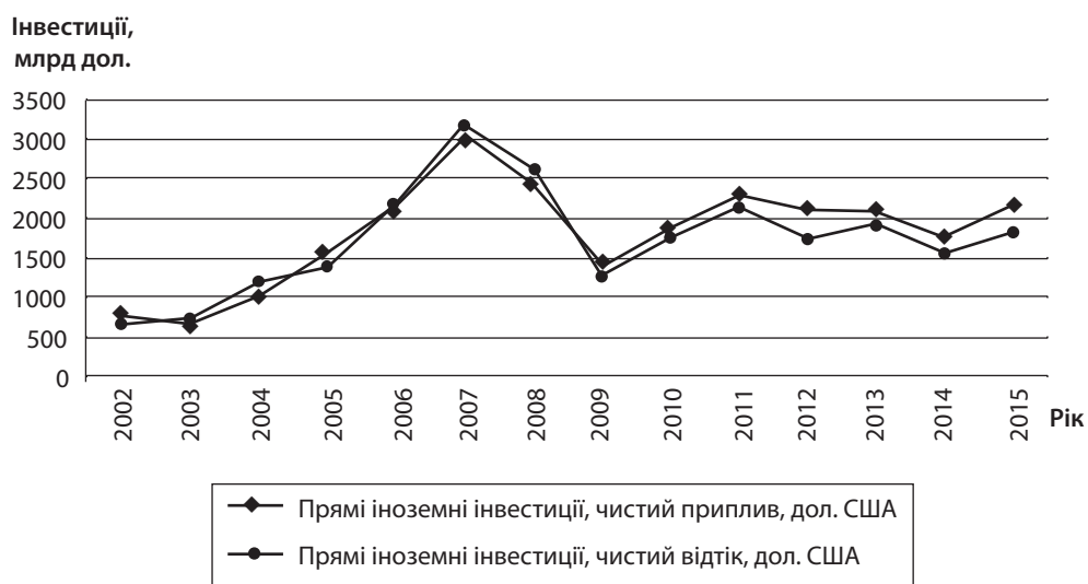
Рис. 2. Світові потоки ПІІ за 2002–2015 рр. [9]

Скорочення обсягів потоків ПІІ відбувалося з різними ознаками у трьох основних регіонах: у розвинених країнах; у тих, що розвиваються; і країнах з перехідною економікою (СНД і Північно-Східної Європи). У розвинених країнах скорочення потоків настало швидше. Вони збалансували становище до 2010 р. У наступних роках відбулося скорочення потоків з часовим лагом на початку 2009 р. Збільшення обсягів ПІІ відбувалося в