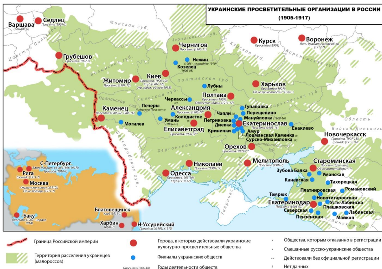
Рис. 1. Украинские культурно-просветительные организации в России (1905–1907 гг.)

С изданием 4 марта 1906 г. временных правил об обществах и союзах, регистрация украинских обществ ускорила. Всего с 1906 по 1908 г. «просвиты» были зарегистрированы в 14 городах России (Щеголев, 1912: 273). Там, где местные власти препятствовали открытию «просвит», их роль выполняли другие организации: украинские клубы, студенческие кружки (гуртки), литературные, музыкальные и театральные общества. Еще в нескольких местах общества действовали нелегально или под другими названиями. Иногда скрытые просвиты действовали под вывесками русских или смешанных обществ. Так, например, общество «Просвещение» в ст. Староминской Кубанской области, будучи по уставу русской просветительной организацией, занималось распространением украинской литературы (Рада. 1911. № 52). Преимущественно просвиты действовали в малороссийских и новороссийских губерниях, причем наиболее развитая сеть существовала именно «на окраинах» расселения малороссов. Культурно-просветительские общества украинцев также открывались в крупных городах империи, где существовали украинские диаспоры – в Петербурге, Москве, Варшаве, Риге, Баку и на Дальнем Востоке (см. рис. 1).