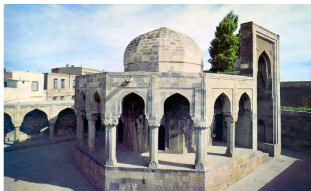
Рисунок 1 - Дворец Ширваншахов в Ичери-шехере.