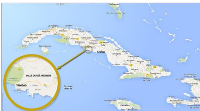
Figura 1. Ubicación del Valle de los Ingenios en el municipio Trinidad, provincia de Sancti Spíritus, en la región central de Cuba.

Los grupos sociales en las comunidades del Valle de los Ingenios, durante más de tres siglos asociaron las actividades cotidianas y de sus vidas a la agroindustria azucarera. No solo dependían en gran medida de esta para la supervivencia económica de sus familias, construyeron también un mundo cultural, social y religioso, asociado a sus maneras de vivir. Esta situación cambió radicalmente a partir de la reconversión de la actividad económica azucarera en el país, provocando impactos insuficientemente estudiados en estas comunidades en los tres componentes fundamentales del desarrollo social: 1) Las condiciones de vida, dadas por su nivel y calidad; 2) La estructura social y 3) La conciencia social. En la figura 1 se presenta un mapa con la localización del Valle.