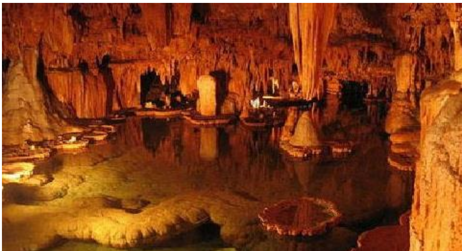
Рис. 1. Пещера Сатаплиа

Для агротуристов созданы сервисные программы, кроме жизни в селе, предусматривает путешествие на природные объекты, с целью ознакомления с флорой и фауной, познавательные туры к историческим местам, грузинские традиции, изучение песен и танцев. С этой стороны Имеретинский регион имеет довольно старые традиции.