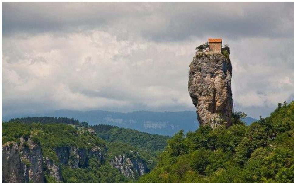
Рис. 2. Кацхский столп

Регион богат горными быстрыми и холодными реками и водопадами, озерами: Квирила, Шемосареби, Гунгумела, Ткемлована, Храмис Тбеби и др.,