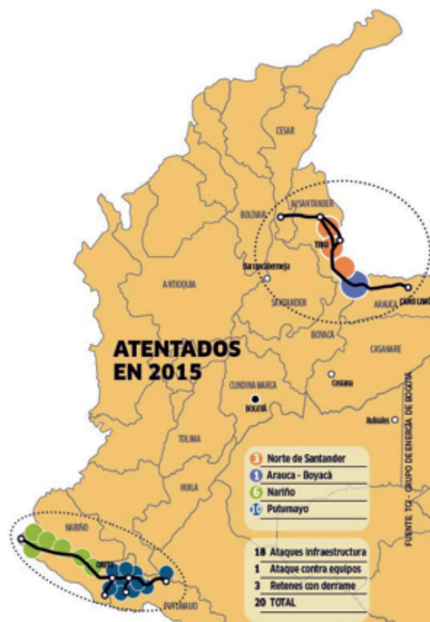
Figura 1. Atentados por grupos al margen de la ley en 2015 que han generado derrames de petróleo.

circunstancias, dichas situaciones se han generado en sectores del país de difícil acceso impidiendo el desarrollo de estrategias de vigilancia y control o en el caso dado, de recuperación. La Figura 1 muestra algunos derrames causados por grupos al margen de la ley en 2015. Este tipo de situación causan una alteración en la calidad del paisaje y en los servicios ecosistémicos -provisión, regulación, soporte y culturales-, que proporcionan los ecosistemas para el normal desarrollo de la vida de los seres humanos.