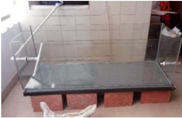
1. Estructura en vidrio y tuberías de entrada y salida de agua