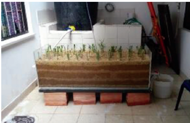
5. Vista del prototipo terminado con plantas, al fondo tanque negro de alimentación