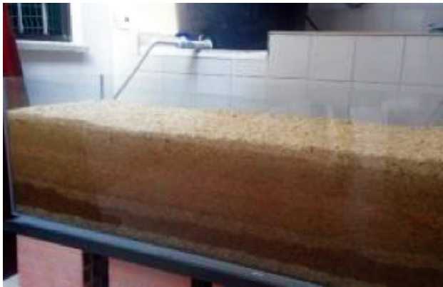
3. Prototipo con sustrato completo a una altura de 35 cm.