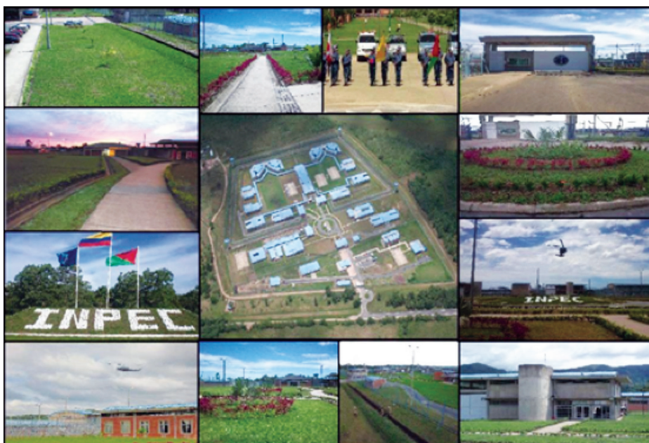
Figura 1. Instalaciones INPEC Yopal

Zona de Estudio: La investigación se desarrolló en el establecimiento penitenciario y carcelario de Yopal, Casanare, Colombia, ubicado en el km 12 Vía Yopal – Aguazul, actualmente cuenta con un terreno de 440.000m 2 . De los cuales 64.661m 2 constituyen la infraestructura del penal y el restante se encuentra destinado para el desarrollo de actividades agropecuarias. En el centro se cuenta con aproximadamente 200 reclusos, la Figura 1 muestra las instalaciones del INPEC.