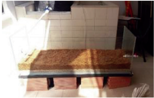
2. Primera capa de sustrato (grava y cascarilla de arroz).