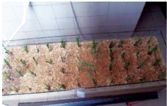
6. Vista del prototipo terminado con plantas