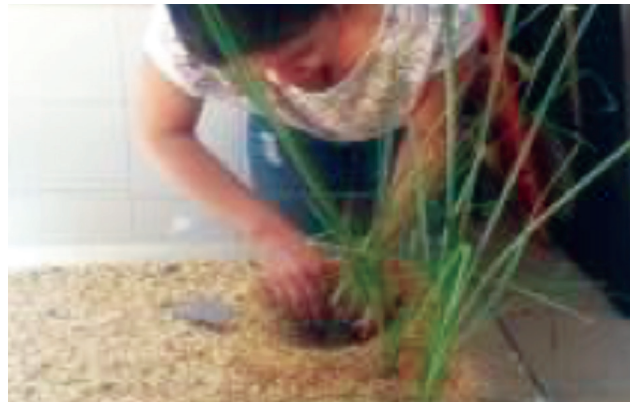
4. Siembra de plantas Vetiver