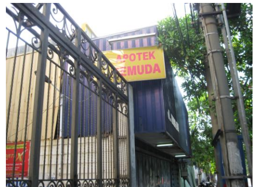
Foto 2. Reklame yang melebihi batas Garis Sempadan Pagar.

(2) Penyelenggaraan reklame menempel pada bangunan dapat dipasang dengan ketentuan bidang reklame tidak melebihi Garis Sempadan Bangunan.