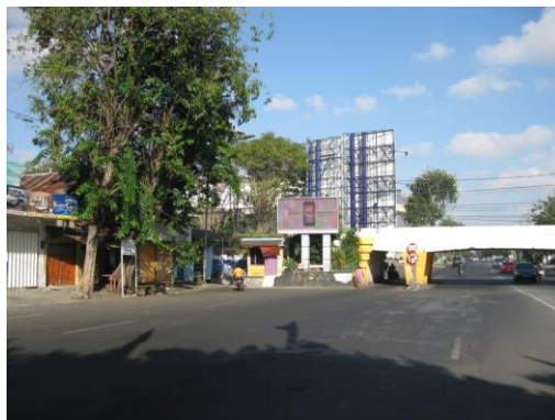
Foto 1 Videotron di kaki viaduct jalur kereta api.

Rinciannya 6 reklame terletak di sisi Utara Jl. Kertajaya, yaitu reklame Rumah Makan Halim, Reklame Happy Day Laundry, reklame toko, reklame Alfamart, Apotek Pemuda dan rokok Dun Hill; dan satu reklame di sisi Selatan Jl. Kertajaya, yaitu reklame Polaris (lihat Foto 2).