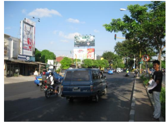
Foto 6. Reklame dalam satu spot yang jaraknya berdempetan.

c. Pada pasal 18 mengenai ketentuan penyelenggaraan reklame pada kawasan penataan reklame bukan persil, disebutkan: