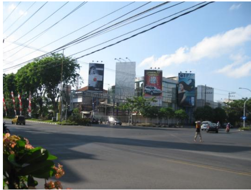
Foto 5. Reklame tanpa materi atau reklame kosong.