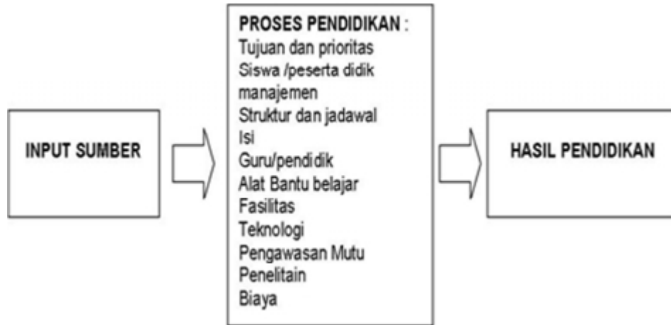
Diagram 2. Input sumber pendidikan

Selanjutnya Syaiful Sagala (2004: 9) menyatakan solusi manajemen pendidikan secara mikro dan makro dituangkan dalam Diagram 3.