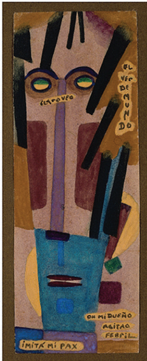
Imitá Mi Pax, 1919

junto a la mujer aparece la palabra GEO, del griego y que significa Tierra, junto al hombre hay dos términos EGO y MAN entablando