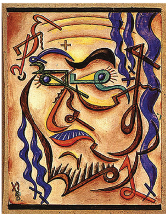
Grafía , 1961

conocimiento le permitió materializar “idiomas” que englobaran saberes distintos en un mismo espacio. De las grafías plastiútiles es esencial rescatar que fueron la forma que halló Xul Solar de comunicar estas ideas a través del lienzo, a través de la pintura y el color, tanto que el elemento semántico es apenas un añadido, probablemente porque es intrínseco a la figura.