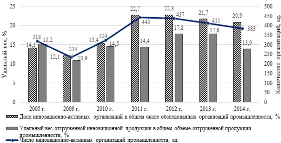
Рисунок 2 – Показатели инновационной активности экономики Республики Беларусь за 2005–2014 гг.

Источник: составлено по данным [7, с. 56; 8, с. 76].