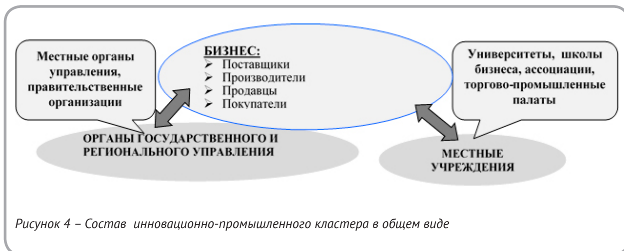
Рисунок 4 – Состав инновационно-промышленного кластера в общем виде

В отличие от традиционных промышленных кластеров, инновационно-промышленные кластеры представляют собой систему тесных взаимосвязей не только между фирмами, их поставщиками и клиентами, но и институтами знаний, среди которых крупные исследовательские центры и университеты, являясь генераторами но-