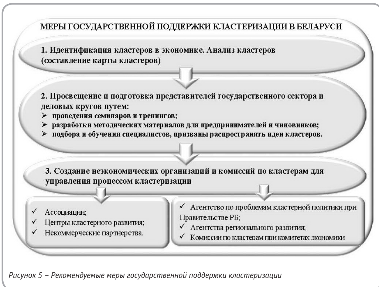
Рисунок 5 – Рекомендуемые меры государственной поддержки кластеризации

В соответствии с эмпирическими заключениями М. Портера по формированию кластерной