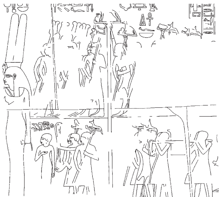
Рис. 4. Хеб-сед Аменхотепа III. Прорисовка фрагмента рельефа. Храм в Солебе