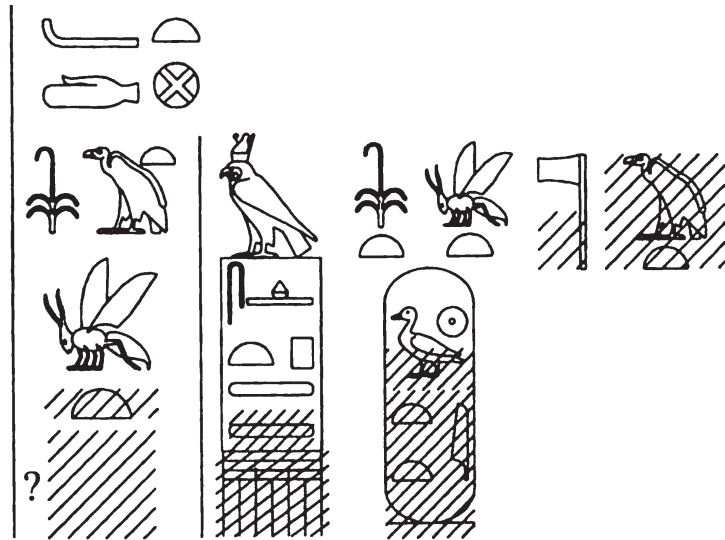
Рис. 2. Реконструкция надписей на блоке