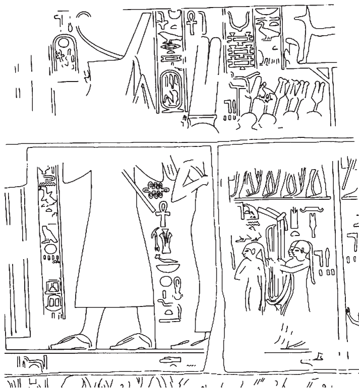
Рис. 5. Хеб-сед Аменхотепа III. Прорисовка фрагмента рельефа. Храм в Солебе