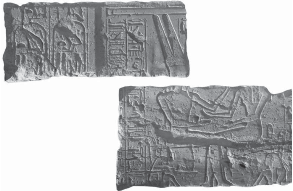
Рис. 7. Блоки со сценами теогамии из Рамессеума

отца Рамсеса II, в теогамии из Рамессеума Туи представлена так, как если бы она была самой Мут 29 . Стоит при этом отметить, что картуши с именами Туи помещены рядом со сценой, в которой будущая мать Рамсеса II изображена сидящей с Амоном-Ра на брачном ложе, причем во втором картуше, содержащем имя «Мути», стоит детерминатив в виде фигуры сидящей богини. Идея рождения царя от союза божественной пары, засвидетельствованная уже при Хатшепсут, также недвусмысленно выражена в надписи на статуэтке Туи, держащей штандарт Мут: «сын Амона, рожденный Мут» ( s3 n Imn mst.n Mwt ) 30 . Иначе говоря, появление у Туи второго имени в форме Мути, отождествлявшего ее с супругой Амона, было одним из способов демонстрации божественного происхождения Рамсеса II, в религиозной политике которого немалое место отводилось созданию собственного образа как объекта культа.