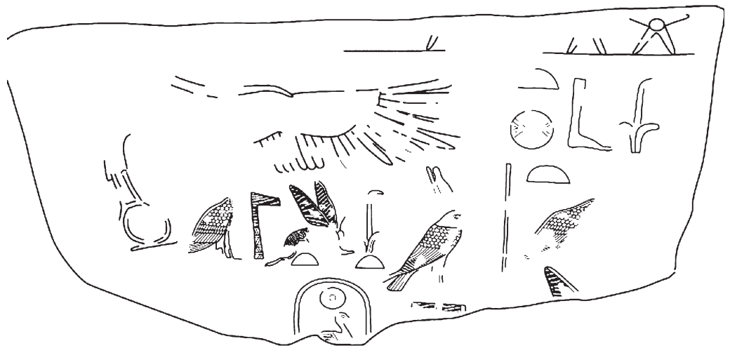
Рис. 3. Прорисовка надписей и изображений на оборотной стороне блока

следующим образом: \text{𓆎} \text{𓆏} ( mwt ntr – «мать бога») 3 (рис. 2). На оборотной стороне упомянутого блока сохранились следы другой надписи, содержащей, по мнению В. Каллэндер, такие же титулы, как и на лицевой стороне (рис. 3). Реконструкция всей надписи представляет собой фрагмент протокола царственной женщины: «мать царя Верхнего и Нижнего Египта... мать бога, Хора, умиротворяющего Обе Земли, царя Верхнего и Нижнего Египта, сына Ра Тети» ( mwt nswt-bity mwt ntr Hr