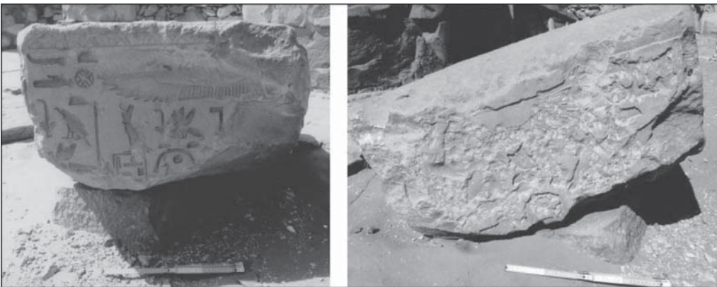
Рис. 1. Блок с титулами Сешешет. Саккара

Первый надежно установленный случай употребления титула «мать бога» датируется серединой XVIII династии, однако его появление могло относиться к значительно более раннему времени: в частности, на фрагменте столба, найденном в припирамидном комплексе Пепи I, частично сохранившаяся надпись содержит титулы анонимной царственной женщины – «мать царя» ( mwt nswt ) и часть другого титула, от которого уцелел лишь знак «бог» ( ntr ) (рис. 1). Несмотря на повреждения надписи, весь титул может быть полностью восстановлен