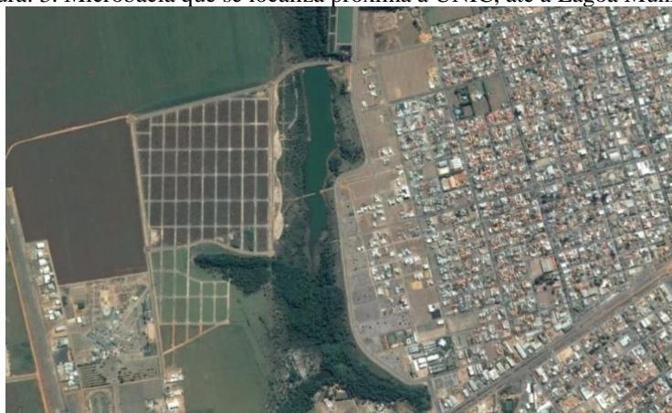
Figura: 3. Microbacia que se localiza próxima à UNIC, até a Lagoa Municipal