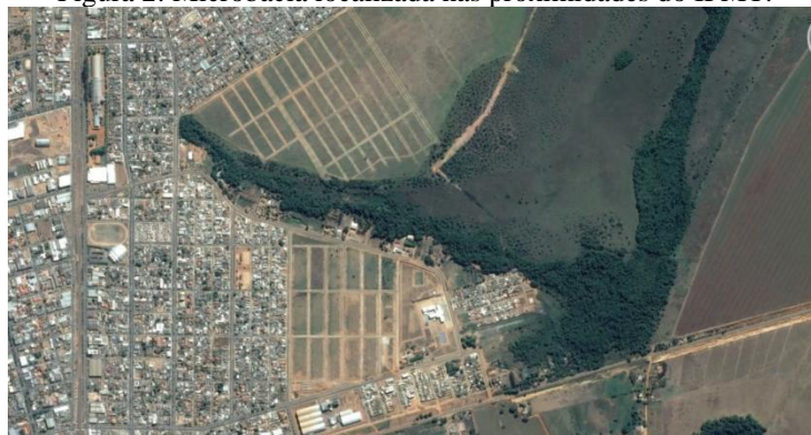
Figura 2: Microbacia localizada nas proximidades do IFMT.

As microbacias/córregos disponíveis para serem escolhidas pelos estudantes no trabalho estão localizadas dentro do perímetro urbano de Primavera do Leste. Para facilitar a sua localização, imagens de satélite foram apresentadas em sala de aula e podem ser verificadas nas figuras 2, 3, 4 e 5.