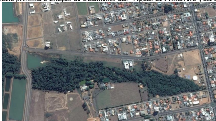
Figura: 4. Microbacia próxima à estação de tratamento das “Águas de Primavera”, até a Lagoa Municipal.