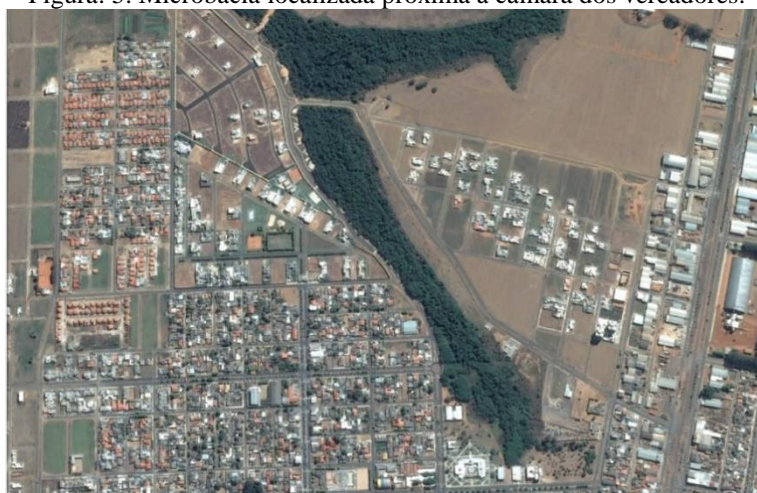
Figura: 5. Microbacia localizada próxima à câmara dos vereadores.