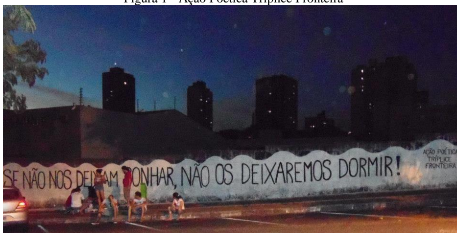
Figura 1 - Ação Poética Tríplice Fronteira