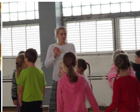
2 pav. Studenčių vedamų pamokų akimirkos.