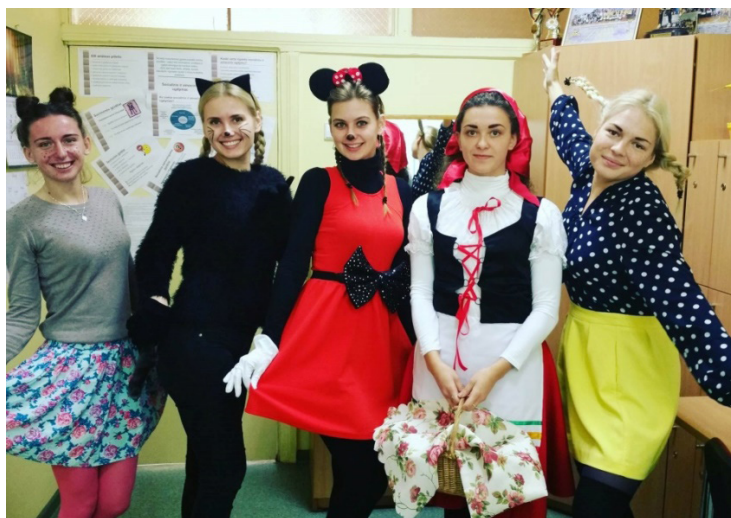
3 pav. Studentės po renginio.

Dar viena svarbi gyvenimo mokykloje dalis – renginiai. Čia jų nemažai tradicinių: „Augu sveikas“, „Savaitė be patyčių“, „Košės diena“, „Apibėk apie mokyklą“. Pastarąjį renginį merginos vedė visiems mokiniams (žr. 3 pav.). Kelis kartus parepetavome mankštą, kad visos penkios sinchroniškai vestume. Tuomet slėpėmės nuo mokinių, kad jie mūsų nematytų ir jiems būtų staigmena. Kai direktorė pranešė, kad dabar laikas mankštai, pasirodėme ir mes. Visi vaikai sureagavo „OOO!“. Mokiniai atspėjo, kur yra jų mokytoja, šaukė jos vardą ir mojavo. Kartu darėme mankštą. Paskui bėgome apie mokyklą. Tada vyko estafetės. Šią dieną gavau daug naujos patirties.