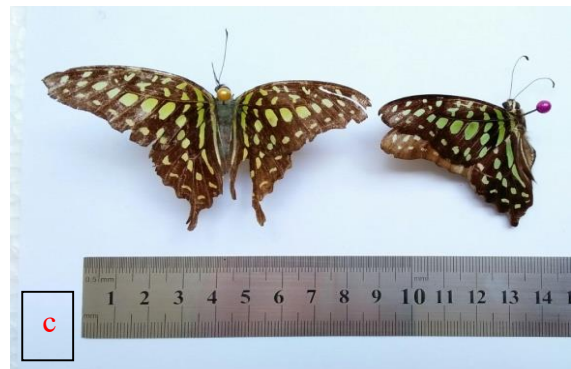
Gambar 1. a. Larva Graphium agamemnon , b. Pupa G. agamemnon , c. Imago G. agamemnon