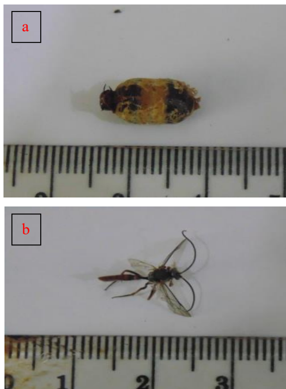
Gambar 2. Parasitoid Diaparsis sp.: a. Fase pupa, b. Fase imago.

Serangga genus Diaparsis merupakan salah satu genus terbesar dari subfamili Tersilochinae. Tercatat 65 jenis di dunia dan 29 jenis di daerah tropis Asia,