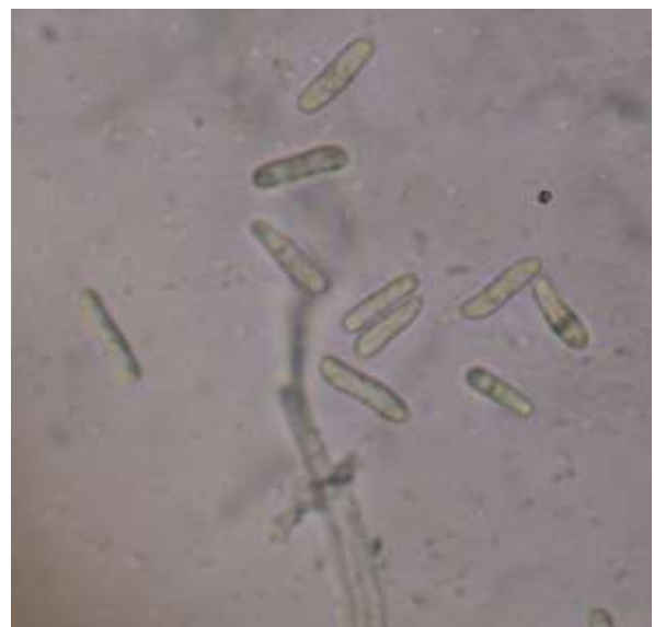
Gambar 3. Konidia Colletotrichum sp. pada media PDA

menentukan sifat-sifat khas seperti bentuk hifa yang berseptat/tidak berseptat, bentuk spora, badan buah, bentuk alat reproduksi dan lain-lain (diagnostik) yang dapat mencirikan jenis fungi dengan menggunakan mikroskop (Street, 1980).