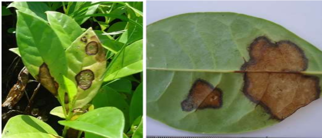
Gambar 2. Gejala penyakit bercak pada daun cempaka

akan menyebabkan kematian pada bibit. Anggraeni (2009) menyatakan bahwa kerusakan pada daun tanaman dapat mengakibatkan proses fotosintesis terganggu. Pada tingkat persemaian hal ini dapat menimbulkan kerugian yang cukup besar karena dapat menyebabkan daun menjadi kering, rontok, yang mengakibatkan terhambatnya pertumbuhan bahkan yang lebih fatal akhirnya bibit akan mati, sehingga mengakibatkan gagalnya penanaman.