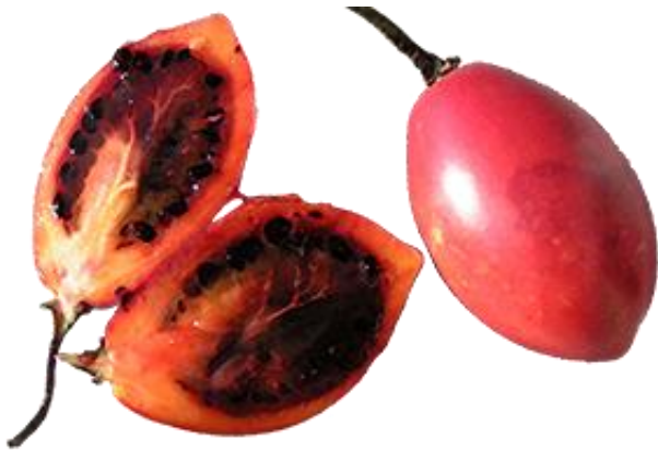
Figura 1.- Fruto de tomate de árbol ( Solanum betaceum ).

Los objetivos de esta investigación fueron desarrollar bebidas energizantes que tuvieran como ingrediente principal pulpa de tomate de árbol, evaluar sensorialmente mediante la metodología CATA (check-all-that-apply) y caracterizar física y químicamente la bebida de mayor aceptación.