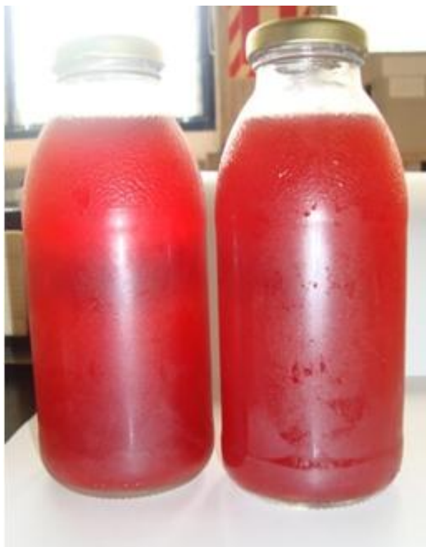
Figura 3.- Bebida energizante con tomate de árbol.

La Fig. 3 ilustra a la bebida energizante con pulpa de tomate de árbol.