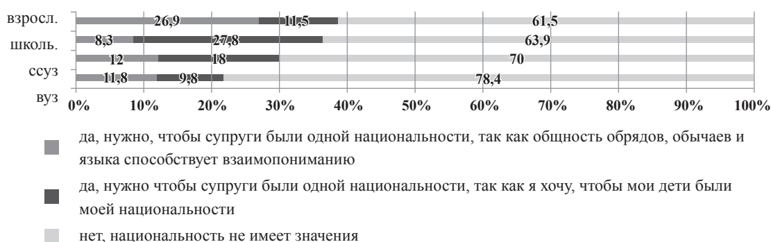
Рис. 3. Распределение ответов на вопрос Важна ли национальность при выборе супруга (супруги), в %.

В целом для учащейся в городских условиях молодежи коренных малочисленных этносов Севера из иерархии демографических ценностей в процессе формирования стратегий социальной адаптации характерно наличие следующих приоритетов: физическое здоровье — 95,8 %; рождение детей — 82,7 %, брачное состояние — 68,8 %, состояние в зарегистрированном браке — 53,2 %.