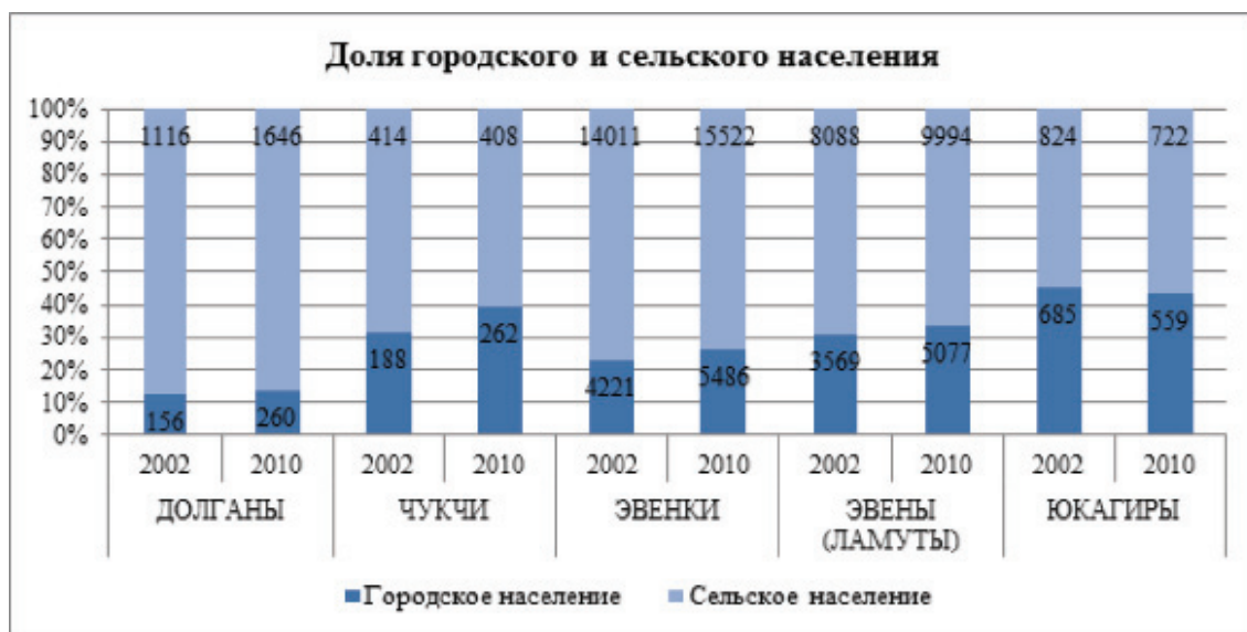
Рис. 1. Доля городского и сельского населения.