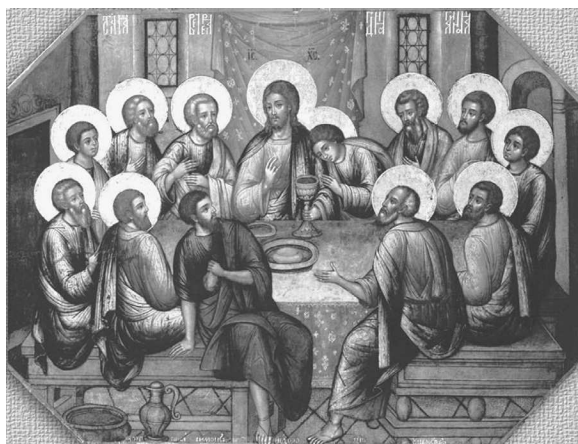
13. Cina cea de Taină , 1685, Simon Ușakov, Catedrala Adormirea Maicii Domnului , Lavra Sf. Treime, Serghiev Posad.

Astfel momentul instituirii Sfintei Euharistii este redat în două dintre cele cinci icoane – în una (fig. 4) Iisus este încadrat de cei doisprezece apostoli, în alta (fig. 8) Mântuitorul fiind reprezentat singur. Celelalte trei icoane (fig. 5-7) reproduc momentul în care Învățătorul comunică ucenicilor Săi despre trădarea unuia dintre ei. Amplasarea icoanelor în instituțiile din care au făcut parte era diferită, astfel, patru dintre ele ar fi putut decora iconostasele lăcașelor de cult din care au făcut parte. Trei (fig. 4, 6, 7) din acestea s-au aflat, după cum pare să fie, deasupra Ușilor Împărătești, cealaltă (fig. 5) probabil a împodobit