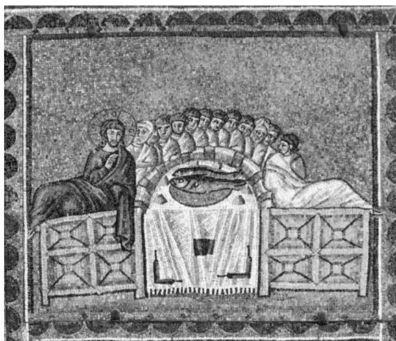
9. Cina cea de Taină , sec. al VI-lea Sf. Apolinarie Nou , Ravenna.

Schema nouă în care apostolii se înfățișează în jurul mesei, iar Iisus Hristos în mijlocul lor, va forma un nou tip denumit de specialiști tipul