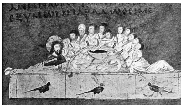
10. Cina cea de Taină , sec. al VI-lea, Codicele Rossanensis .