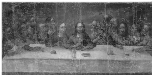
6. Cina cea de Taină, sf. sec. al XIX-lea-înc. sec. XX, colecția MNIM.