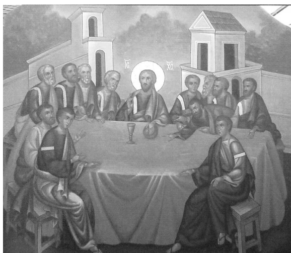
12. Cina cea de Taină , sec. al XVIII-lea, Biserica Adormirea Maicii Domnului , Muzeul Satului, Chișinău.