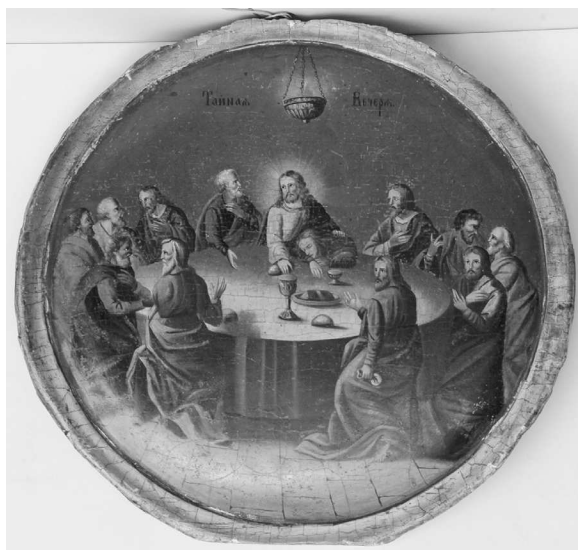
5. Cina cea de Taină, sf. sec. al XIX-lea, colecția MNIM.