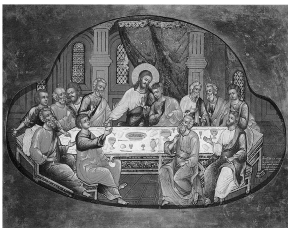
2. Cina cea de Taină, 1694, Ivan Mihailov, Muzeul Național Rus, Sankt Petersburg.