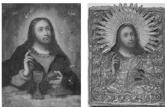
8. Cina cea de Taină, sf. sec. al XIX-lea, colecția MNIM.

Primele imagini cu referință la Cina cea de Taină apar în secolul al VI-lea în cele două versiuni menționate anterior tipul istoric și tipul liturgic, sau, după cum le clasifică alți specialiști, tipul A care evocă textele evanghelice, înfățișând Cina Mântuitorului Iisus Hristos cu cei doisprezece ucenici și tipul B, care reprezintă scena Împărtășania apostolilor . Aceste imagini au fost interpretate în mod diferit în cultura orientală și în cea occidentală. În cea apuseană scenele de tipul A erau