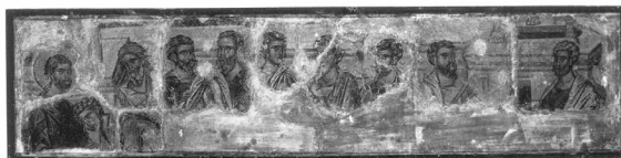
11. Cina cea de Taină , sec. al XIV-lea, Biserica Sf. Nicolae , Curtea de Argeș.

simetric. Aceste imagini își au începuturile în iconografia siriana încă din secolul al XIII-lea care s-a inspirat, la rândul său, din manuscrisele siriene din secolul al XII-lea. Ele vor deveni populare în pictura balcanică și în cea rusească, cu toate că specialiștii ruși califică aceste reprezentări drept reminiscențe iconografice neevoluate în timp. În calitate de model va fi acceptată compoziția în care Hristos și Ioan lipindu-se de El se reprezintă în partea stângă a mesei, ceilalți apostoli fiind poziționați în jurul mesei, Iuda cu mâna întinsă spre blid aflându-se în centrul compoziției (Бобров 1995, 48).