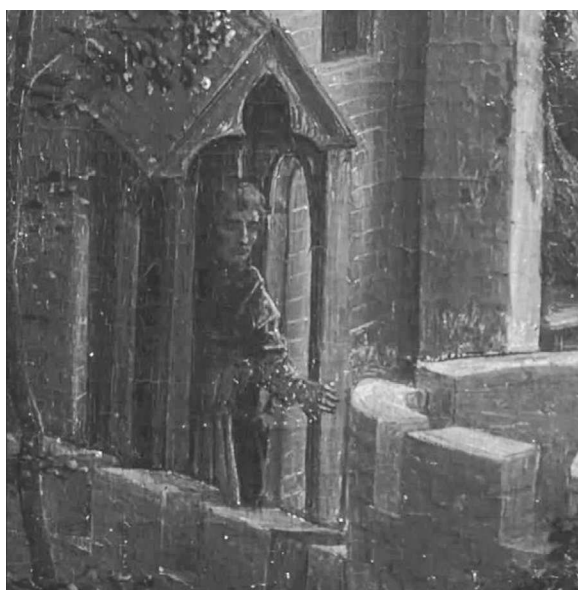
3. Cina cea de Taină, fragment din tabloul Patimile lui Hristos , 1470, H. Memling, Galeria Sabauda, Torino.

De cele mai dese ori zugravii îl reprezintă pe Iuda fără nimb , spre deosebire de ceilalți apostoli. Așa îl vedem în naosul bisericii de la Săcuieni (Pilat 1980, fig. 56) sau în aceeași scenă de la Bălinești. La fel îl vedem și pe icoana Cele 12 Sărbători Împărățești , datată din secolul al XVIII-lea din colecția Muzeului Mănăstirii Rila din Bulgaria (Пращков 1976, 84, № 128). Unii cercetătorii afirmă că reprezentarea lui Iuda fără nimb este specifică mai mult iconografiei capadociene, cele mai timpurii imagini de acest fel fiind frescele din Balikli-Kilise ce datează din secolul al XI-lea (Панайотова 1965, 190).