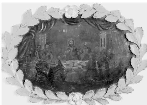
7. Cina cea de Taină, sf. sec. al XIX-lea, colecția MNIM.

Pe o altă icoană 6 (fig. 7) evenimentul are loc într-o odaie decorată deosebit de celelalte compoziții. Aici apare arhitectura de fundal, o draperie albastră-gri în pliuri ample, prinsă în câteva locuri. Apostolii stând la o masă dreptunghiulară