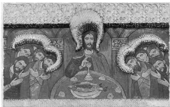
14. Cina cea de Taină , 1907, Nikolai Roerich, Biserica Icoana Maicii Domnului din Kazan , Mănăstirea Adormirea Maicii Domnului , or. Perm.