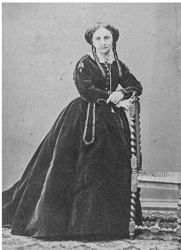
13. O doamnă din elitele sociale basarabene îmbrăcată conform ultimelor tendințe de modă.

tretele pe suport fotografic în stil „carte de vizite”, fotografiile de grup fiind primite cu entuziasm de acest nou mediu social.