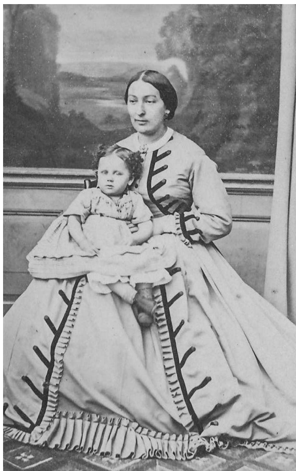
5. Imaginea unei doamne cu un copil în brațe din elitele sociale basarabene, fotografie „carte de visite”, al treilea sfert al sec. XIX, fotocredit: MNEIN FB-24108/95.

multe ori de-a lungul unui bal sau petreceri (fig. 4). Purta rochii lungi cu multe volane, se foloseau în continuare cercurile dar unele rochii erau doar scrobite. Frumoasele epocii stăteau în picioare în caleștile lor ca să nu își șifoneze rochiile până la bal (vintageromania.com 2011).