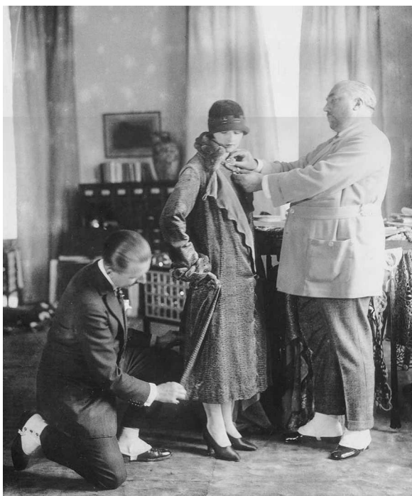
18. Modelierul Paul Poiret, începutul sec. XX

Moda a evoluat încet dar sigur, fiind evitate din ce în ce mai mult cercurile pentru rochii și femeile fiind din ce în ce mai mult atrase de libertatea de mișcare și de sport. Rochiile aveau în continuare trene dar erau mai puțin voluminoase, bogat împodobite cu jabouri, pasmanterie și mărgele. Majoritatea erau făcute din tafta-brocart scrobit iar culorile purtate erau magenta, verde, galben și albastru. Corsetele erau strâmte, cu nasturi până la gât, cu gulere și jabouri din dantelă, mâneci strâmte, fie trei-sferturi fie lungi, dantelate. Rochia Watteau continuă să inspire moda. Apare „poloneza”. Apar totodată costumele cu linie masculină influențate de costumele de călărie (fig. 19). Hainele și jachetele erau create în această perioadă cu mâneci dolman. Se purtau pălării mici, bijuterii cameo, evantaie și umbrele (vintageromania.com 2011).