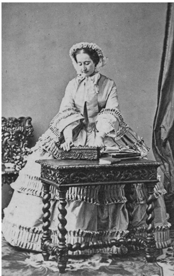
4. Împărăteasa Eugenia a Franței, circa 1858