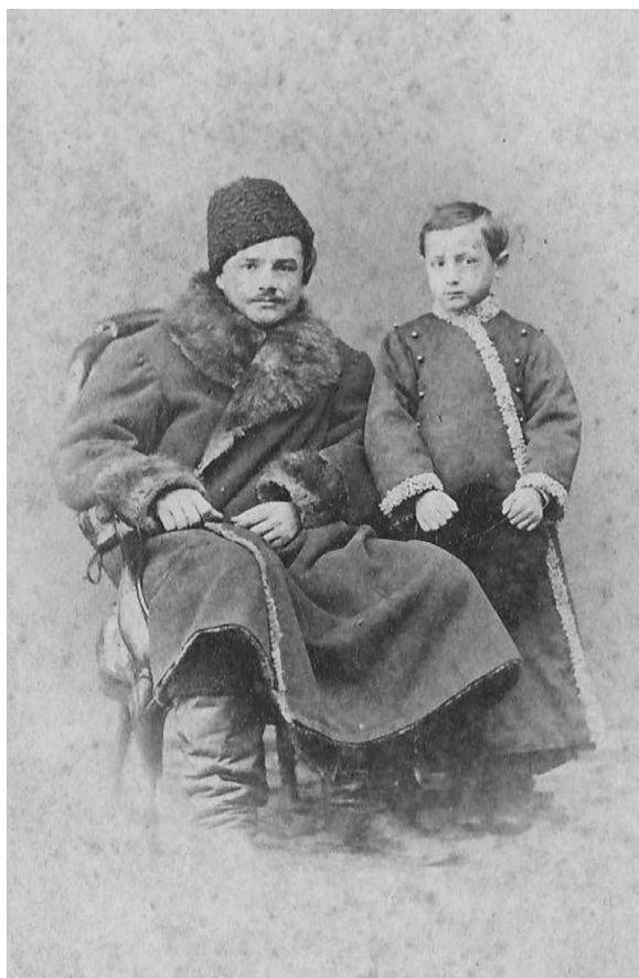
11. Îmbrăcăminte de iarnă în imaginile de epocă basarabene, fotografie „carte de visite”, a doua jumătate a sec. XIX, fotocredit: MNEIN FB 24108-54.

pantaloni, 210 gulere, 145 cravate, cinci jachete, trei redingote, 40 cămași de noapte, patru halate de baie, bască, frac, smoking și 124 cămași... ” (Ionescu 2006, 192).