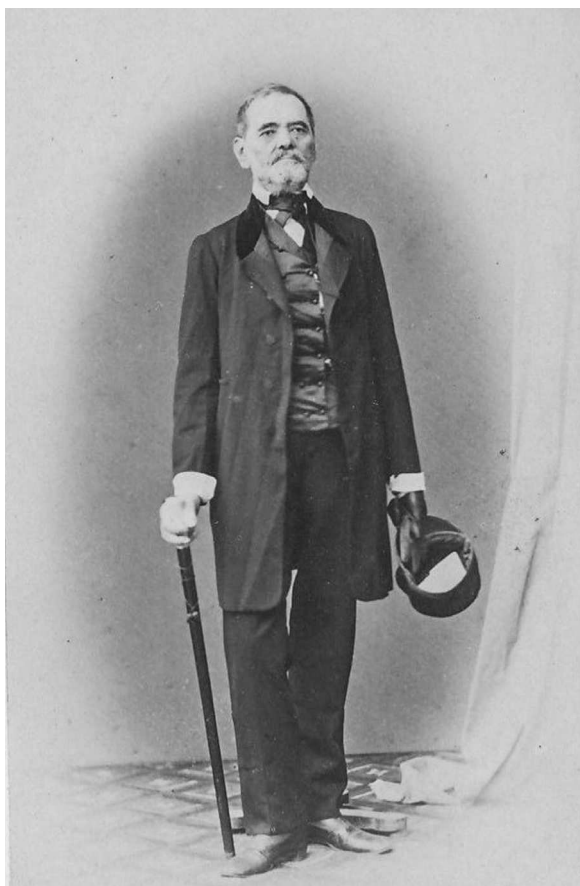
10. Domn din elitele sociale basarabene, fotografie „carte de visite”, al treilea sfert al sec. XIX, fotocredit: MNEIN FB 24108-89.