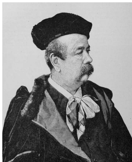
16. Părintele designului vestimentar, Charles Frederick Worth, fotografie executată de Nadar, 1895