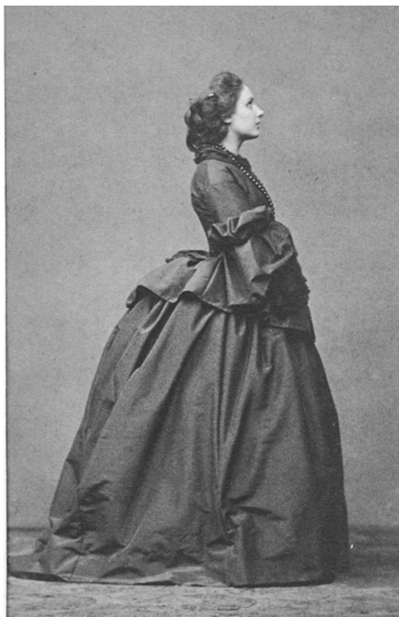
15. Virginia Oldoini, Contesa de Castiglione, 1860

Cel care a propus renunțarea la crinoline, în favoarea turnurilor, a fost englezul Charles Frederick Worth (1825-1895), întemeietorul Casei de modă „ Worth ” (fig. 16). Părintele designului vestimentar, cum i se mai spune, s-a născut în Anglia. El a fost primul creator de modă și totodată cel