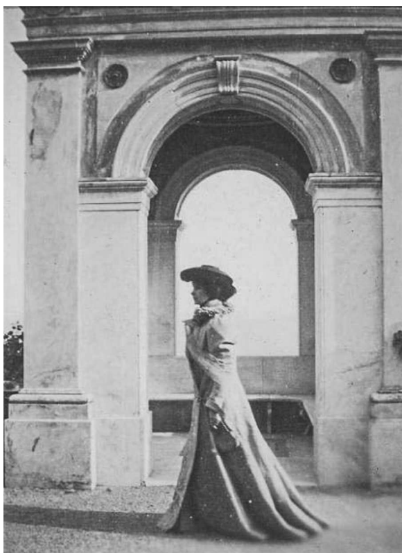
12. Modelul Olga de Meyer, fotografie executată de baronul Adolph de Meyer, 1900