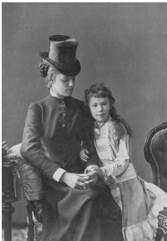
19. Împărăteasa Austriei și Regina Ungariei Elisabeta, mijlocul anilor '70, secolul XIX