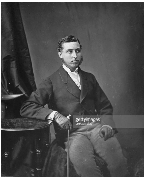
8. Regele Eduard al VII-lea al Regatului Unit, 1860