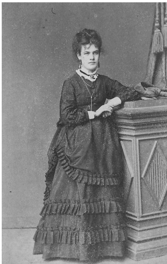
7. Doamnă din elitele sociale basarabene pozând într-un atelier fotografic, imagine tip „carte de vizite”, al treilea sfert al sec. XIX, fotocredit: MNEIN FB-24108/86.

Odată cu anul 1890 au început să se croiască în special costume compozite, influențate de moda secolelor XVI-XVIII, culorile fiind în general pastelate (crem, roz, bleu, gri, auriu).