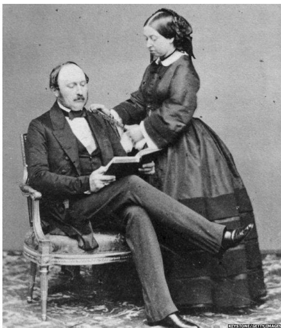
2. Regina Victoria și Prințul Albert la Palatul Buckingham, 1860