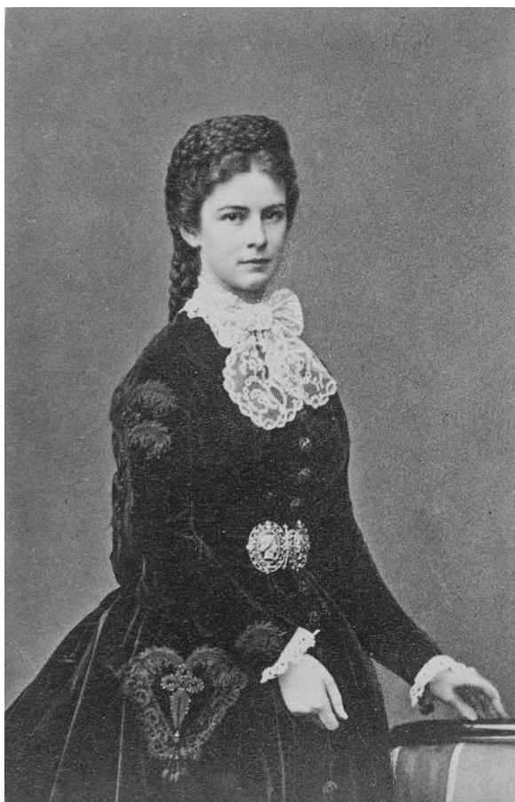
6. Împărăteasa Austriei și Regina Ungariei Elisabeta, mijlocul anilor '60, secolul XIX