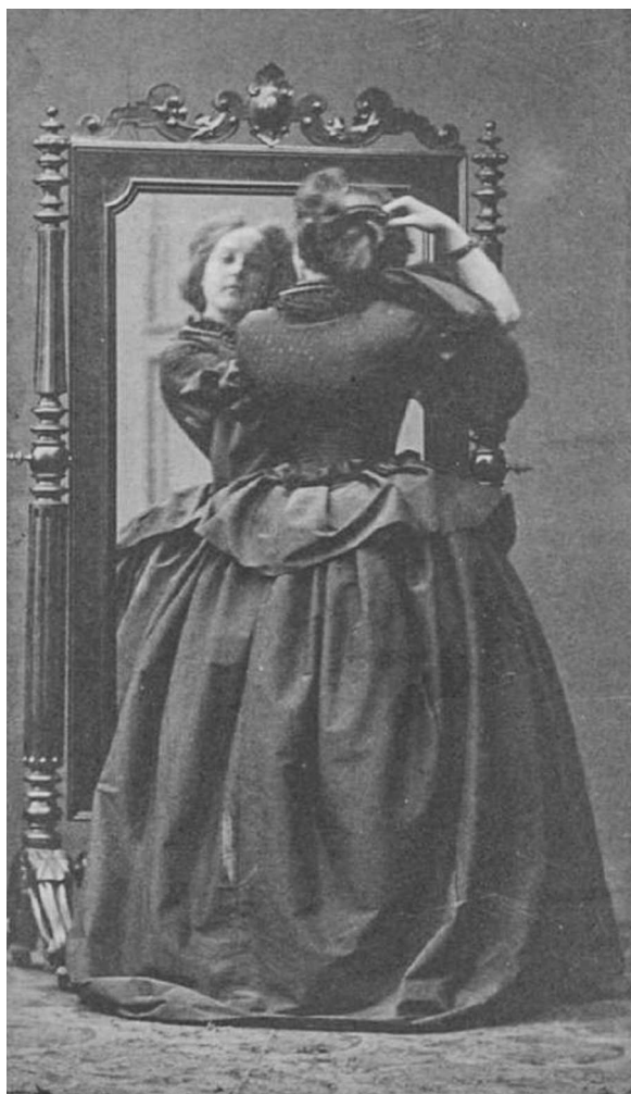
17. Virginia Oldoini, Contesa de Castiglione,.

După ce a lucrat la o fabrică, a continuat cu bussinessul în domeniul stofei în Londra, după care, în 1846, a ajuns în Paris unde, pe parcursul a doi ani, a lucrat pentru „ Gagelin-Opigez et Cie. Gagelin-Opigez ”, specializându-se în crearea accesoriilor de damă dar și în vestimentație. Curios este faptul că Worth nu a primit nici o mențiune importan-