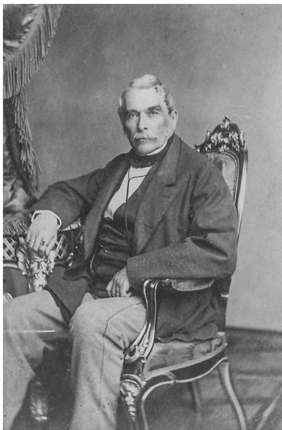
9. Domn din elitele sociale basarabene, fotografie „carte de visite”, al treilea sfert al sec. XIX, fotocredit: MNEIN FB 24108/99.

În a doua jumătate a secolului al XIX-lea, costumul pentru bărbați nu a suferit modificări substanțiale, în schimb au fost adăugate unele elemente vestimentare noi. Modelele costumelor au devenit mult mai stricte ca stil și utilizare: de vizită, de bal, pentru acasă și de fiecare zi, care au devenit „de lucru”. Noul tip de costum, zis și „de vizită”, era un elegant costum de stradă, îmbrăcat și pentru diferite serbări mai mici (fig. 9).