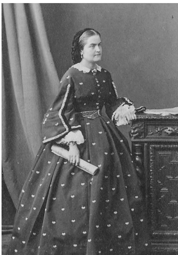
3. Vestimentația unei doamne din elitele sociale basarabene, fotografie „carte de visite”, al treilea sfert al sec. XIX, fotocredit: MNEIN FB 24108/74.

Moda oglindea și întruchipa în sine acele metamorfoze care au avut loc cu femeia din acea vreme pe parcursul a câtorva decenii dramatice până la Primul Război Mondial (Стил 2013).