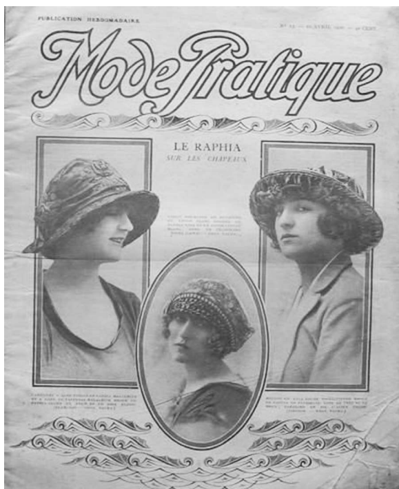
14. Revista „La Mode Pratique”, sf. sec. XIX

Periodicele au fost importante transmițătoare de idei și practică pentru un public avid de cunoștințe și informații în domeniul modei și stilului vestimentar. Scriitorii și publiciștii de la majoritatea publicațiilor înțelegeau responsabilitatea pe care o au în fața cititorilor, intitulându-și articolele cu „ Scrisori din Paris ” și altele de acest fel. Vocabularul de modă utilizat în magazine includea deja cuvintele „ toaletă ” și „ costum ”.