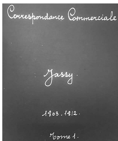
Fig. 1. Foaia de titlu. Correspondance Commerciale. Jassy. 1803-1812. Vol. 1.

Limita superioară a cercetării corespunde anului 1866. Chiar dacă la acel moment Principatul Moldovei nu mai exista din 1859, când a avut loc Mica Unire, însă abia prin Constituția din 1866 se legitimează numele de România. Din aspectul