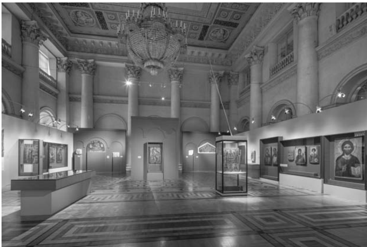
Фото 2. Вид экспозиции выставки «Византия сквозь века» в Николаевском зале Зимнего дворца, 24 июня - 2 октября 2016 г.

со всех концов Империи свозились шедевры искусства на берега Босфора. Мраморные и бронзовые скульптуры, бюсты, колонны, обелиски наводнили столицу. Византийцы жили, окруженные великими произведениями древней пластики, к которым они быстро привыкли и довольно спокойно воспринимали и их языческое происхождение, и их «обнаженное бесстыдство». Насыщенность Константинополя замечательными памятниками древности, несомненно, сыграла важную позитивную роль в формировании рафинированного художественного стиля столицы. Пропорциональные соотношения, положение тела в пространстве, поворот головы, характер складок драпировок и многое другое столичные мастера с успехом заимствовали у своих предшественников. На основе свезенных из разных регионов Империи разновременных и разностильных, но выдающихся произведений древности оттачивали византийцы свое удивительное художественное мастерство. Константинополь недаром называли «горнилом», где разнообразие региональных, стилевых и