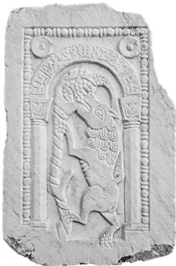
Фото 3. Мраморный рельеф «Лев, поедающий финики с пальмы». Византия. Ок. 1000 г. Археологический музей Древнего Коринфа.

Следующий раздел выставки был связан с особым явлением – искусством крестоносцев в Византии. Четвертый крестовый поход и взятие Константинополя в 1204 году западноевропейскими рыцарями привели к созданию целой сети «латинских» государств, княжеств и владений на значительной части бывшей Ромейской империи. Однако начавшийся еще в XII столетии процесс децентрализации Византии, этим не закончился и с переменным успехом продолжался вплоть до XV века, пока не был остановлен завоеваниями Османов. Трагедия 1204 года привела к созданию независимых греческих государств «на развалинах» Византии: Никейская и Трапезундская империи, Эпирское царство. Одновременно возникли