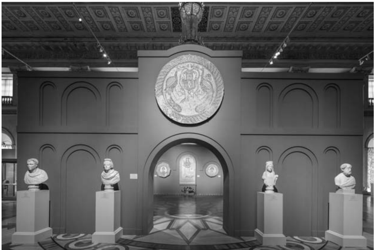
Фото 1. Вид экспозиции выставки «Византия сквозь века» в Николаевском зале Зимнего дворца, 24 июня - 2 октября 2016 г.

Центральное пространство Николаевского зала занимали памятники позднего римского и ранневизантийского времени, они демонстрировали тот базис, на котором шло формирование нового христианского искусства, шло не в яростной борьбе, как иногда считают, а естественным и органичным, хотя и непростым путем. Именно эллинистическо-римская культура была той основой, которая сплотила космополитичную Византию. Культура, искусство, стремление ко всему прекрасному – вот те аспекты византийской цивилизации, которые магически завораживали Средневековый мир; и это те аспекты, которые Эрмитаж стремился продемонстрировать на выставке. Основав новую столицу, Константин Великий наполнил ее многочисленными сокровищами древних мастеров;