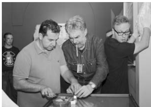
Фото 5. Монтаж выставки «Византия сквозь века» в Николаевском зале Зимнего дворца, июнь 2016 г.