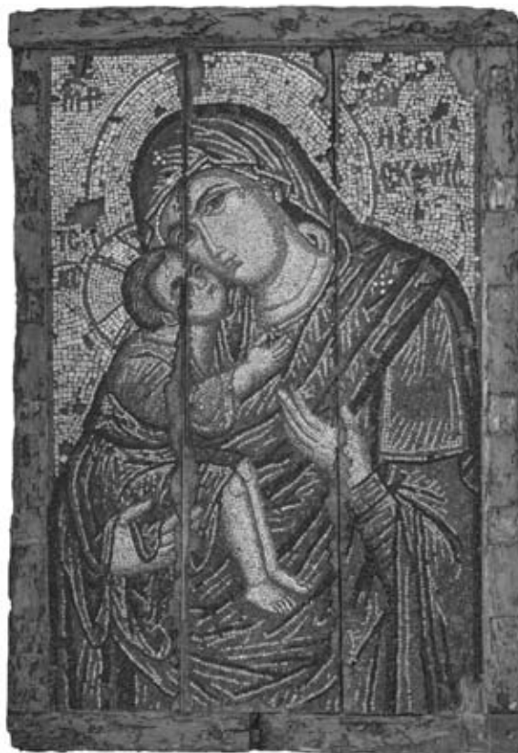
Фото 4. Мозаичная икона «Богоматерь Эпискепис». Византия, Константинополь. Конец XIII в. Византийский и Христианский музей в Афинах.

Одна из стен Николаевского зала на всю его длину – более 66 метров, – была занята витринами с Палеологовскими иконами XIV - середины XV века. Взглядом можно было охватить этот удивительный ряд крупных и маленьких, ярких и сдержанно-аскетичных образов. Одни