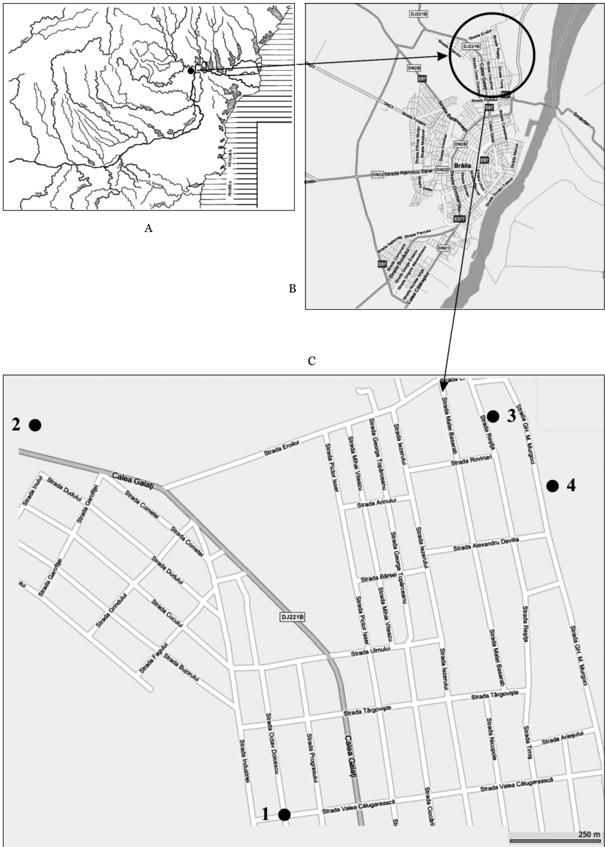
Fig. 1. Harta: A. SE România; B. Municipiul Brăila (apud www.hartabrailei.ro ); C. Cartier Brăilița - detaliu (apud www.hartabrailei.ro ). 1 - Cartier Progresu; 2 - Str. Galați, nr. 370-372; 3 - Reșița, nr. 62; 4 - Str. Gh. Munteanu Murgoci nr. 12.