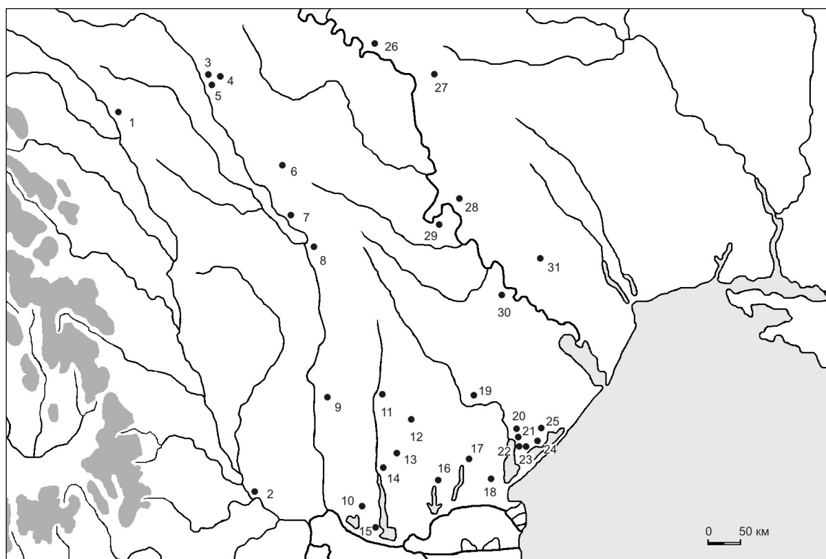
Рис. 1. Распространение погребений с вытянутыми скелетами периода энеолита и начала бронзового века в Северо-Западном Причерноморье: 1 - Корлэтенъ; 2 - Лунгочь-Фундень; 3 - Думень; 4 - Вэратик; 5 - Дуруитоаря Ноуэ; 6 - Бурсучень; 7 - Петрешть; 8 - Сэрэтенъ; 9 - Крихана Веке; 10 - Етулия; 11 - Казаклия; 12 - Огородное III; 13 - Кубей; 14 - Болград; 15 - Новосельское; 16 - Суворово; 17 - Холмское; 18 - Десантное; 19 - Арциз; 20 - Белолесье; 21 - Новоселица; 22 - Траповка; 23 - Вишневое; 24 - Кочковатое; 25 - Желтый Яр; 26 - Окница; 27 - Тимково; 28 - Красное; 29 - Бэлэбэнешть; 30 - Талмаз; 31 - Никольское.

По своим очертаниям и пропорциям могильные ямы с вытянутыми скелетами можно разделить на три ведущих типа. Первый тип представлен камерами овальной формы или подпрямоугольными ямами с сильно закругленными углами, то есть близкими к овалу, с соотношением длины и ширины приблизительно 1:2. Ко второму типу относятся узкие продолговатые ямы, в которых соотношение длины и ширины примерно равняется 1:3. Третий составляют собственно прямоугольные камеры больших размеров с четко выделенными углами.