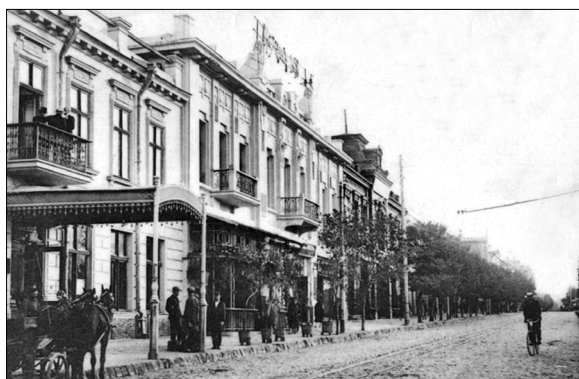
4. Vedere exterioară a hotelului Palas , înc. sec. XX.