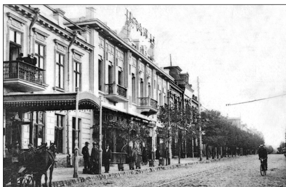
3. Vedere exterioară a hotelului Londra , înc. sec. XX.