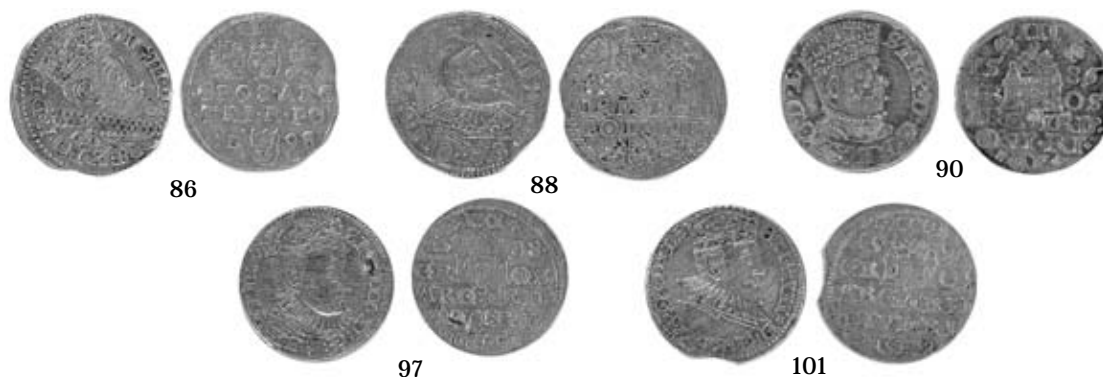
Fig. 3. Monede din tezaurul Parcani.