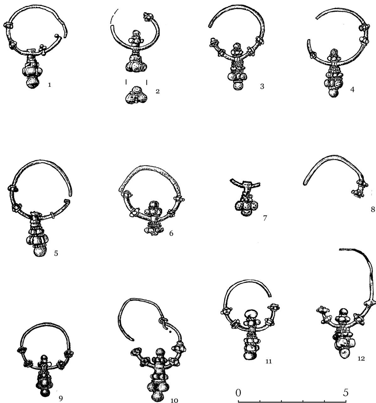
Рис. 2. Серёжки екимэуцкого типа из погребений кочевников в бассейне р. Тисы: 1-8 - Чома; 9 - Дёге; 10 - Тисаберцел; 11-12 - Ибрань. 9-12 (по Э. Иштванович).

датируется не ранее 60-х гг. X в. Наиболее вероятно, что свидетельства о локализации части печенежских племён внутри Карпатской дуги были вставлены в Парижскую редакцию произведения (XI в.) после смерти императора, когда изменились реалии размещения отдельных племён Европы.