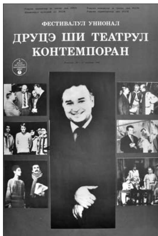
6. Afiş. Festivalul Unional „Ion Druță și teatrul contemporan”, Chișinău, 1988.