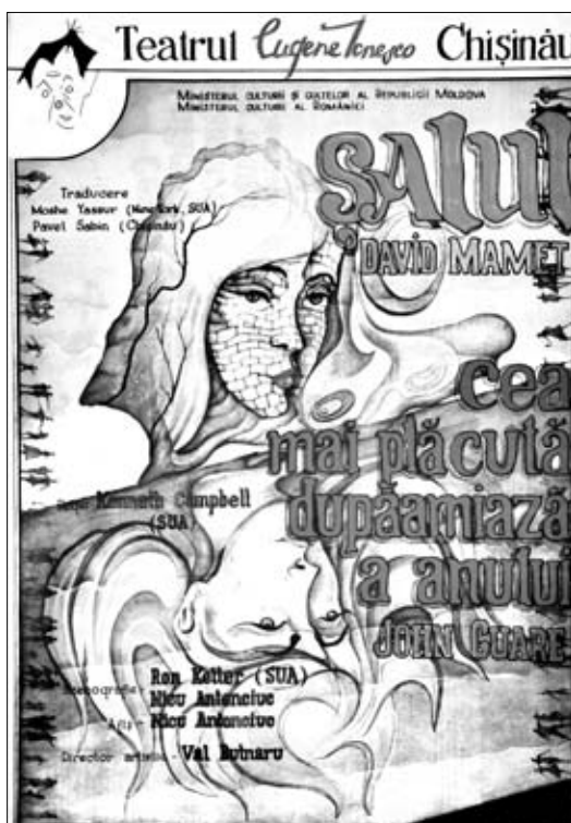
11. Afiș. Spectacolul „Cea mai plăcută dupăamiază a anului” de John Guare. Teatrul „E. Ionescu”, anii '90 sec. XX.