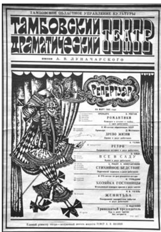
9. Afiș. Repertoriul Teatrului Dramatic din Tambov „A.V. Lunacearski”, în turneu la Chișinău, 1982.