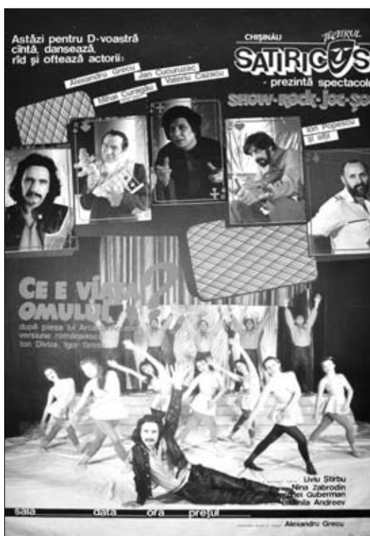
13. Afiș. Spectacolul „Ce e viața omului” de A. Arkanov. Teatrul „Satiricus I.L. Caragiale”, anii ‘90 sec. XX.