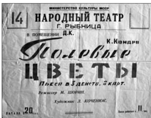
15. Afiș. Spectacolul „Flori de câmp” de C. Condea. Teatrul popular din Râbnița, 1961.