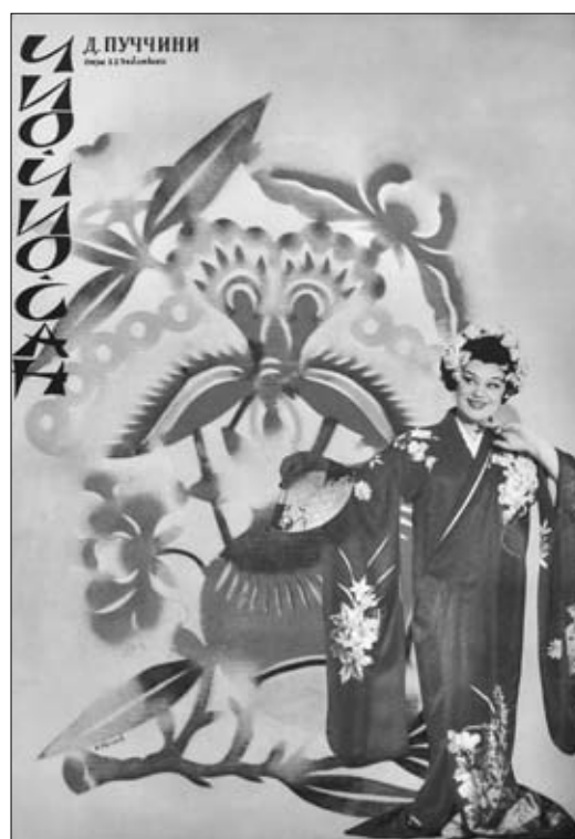
14. Afiș. Opera „Cio-Cio-San” de G. Puccini. Teatrul de Operă și Balet, anii ‘90 sec. XX.