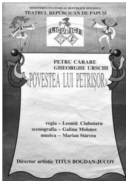
8. Afiş. Spectacolul „Povestea lui Petrișor” de P. Cărare și Gh. Urschi. Teatrul Republican „Licurici”, anii '90 sec. XX