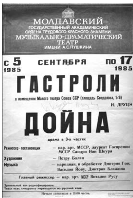
5. Afiş. Spectacolul „Doina” de I. Druță, turneul Teatrului Moldovenesc Academic Muzical-Dramatic de Stat „A.S. Pușkin, la Teatrul Mic din Moscova, 1985.