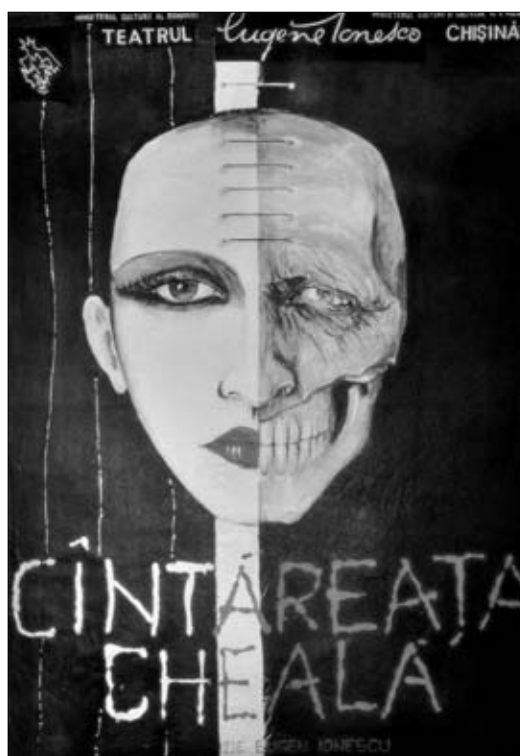
10. Afiș. Spectacolul „Cântăreata cheală” de E. Ionescu. Teatrul „Eugen Ionescu”, anii '90 sec. XX.