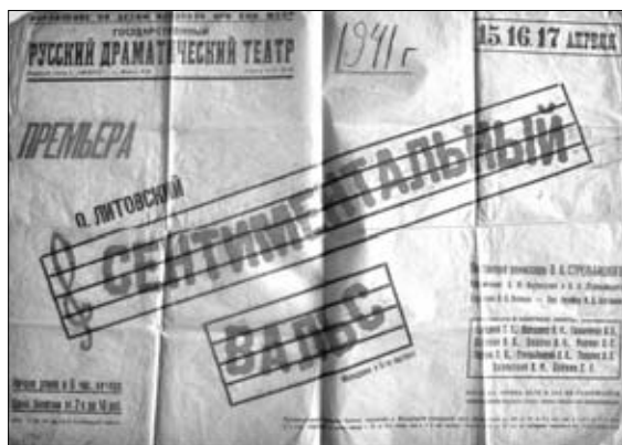
2. Afiș. Spectacolul „Valsul sentimental” de O. Litovski, Teatrul Dramatic Rus din Chișinău, 1941.