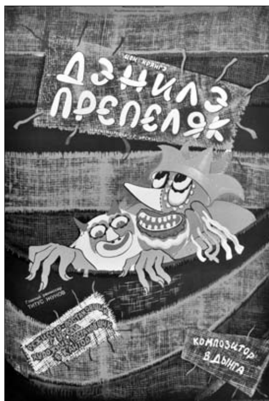
7. Afiş. Spectacolul „Dănilă Prepeleac” de I. Creangă. Teatrul Republican „Licurici”, 1985.