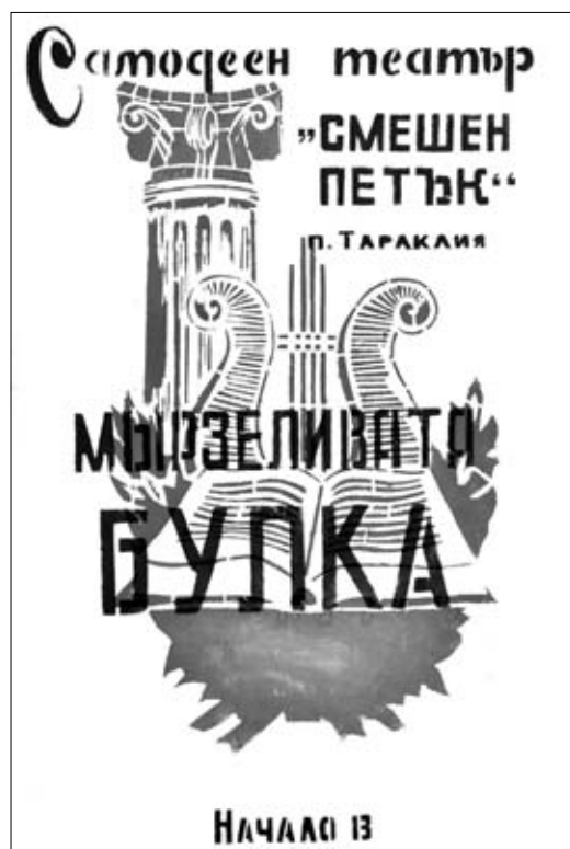
16. Afiș. Spectacolul „Мързеливата булка” („Nora Ieneșă”). Teatrul popular „Смешен Петък” din Taraclia, (nedatat).