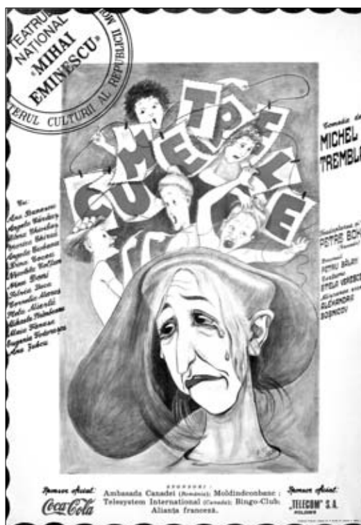
12. Afiș. Spectacolul „Cumetrele” de Michel Tremblay. Teatrul Național „M. Eminescu”, anii '90 sec. XX.