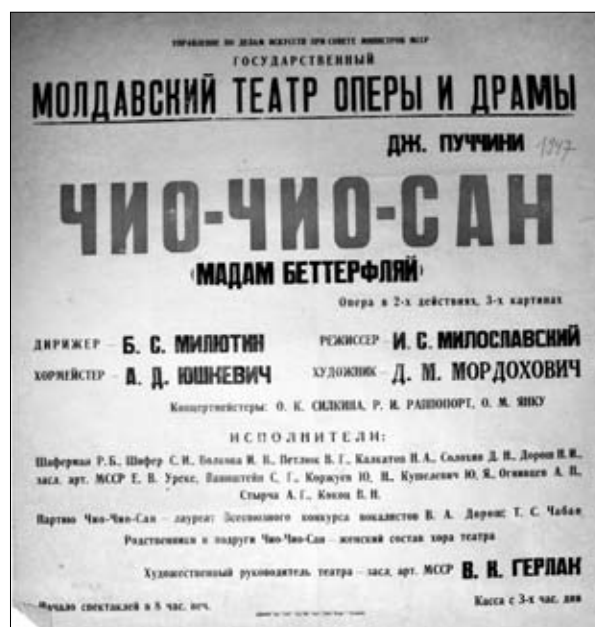
3. Afiș. Opera „Cio-Cio-San” de G. Puccini, Teatrul Moldovenesc de Operă și Dramă, 1947.