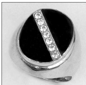
Fig. 2. Inel pentru bărbați. Aur, fianit. Fabrica de Bijuterii „Giuvaiier” din Chișinău.