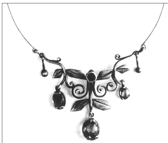
Fig. 4. A. Marco. Colier. Argint, alpaca, pietre ornamentale.

Colierul din setul Moldova reprezintă o salbă monetară stilizată și modernizată. Este confecționat dintr-o bară metalică integră răsucită proporțional, acordând senzația unei împletituri/rețele decorative. Centrul compoziției înglobează elemente decorative, în special, discuri aplatizate și laminate în formă de monede, de mărimi mari și mărimi mai reduse, asociate cu inserții de coral roșu-portocaliu. Mărgelile de coral posedă mici orificii prin care este strecurată sârma laminată, îndoită în forma unei spirale sau, mai bine spus, forma vrejului de viță-de-vie. De menționat că cârligele de fixare ale inserțiilor și discurilor metalice formează elemente decorative originale care acordă un suflu nou bijuteriei descrise de noi: elemente în formă de spirală ca simbol al continuității vieții, al dinamicii mișcării, vrejul de viță-de-vie, romb, cercul ca emblemă solară, linii drepte și intercalate etc. Aceste simboluri sunt frecvent întâlnite pe prosoapele naționale, covoaa-