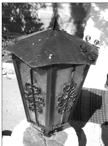
Fig. 8. Felinar din curtea mănăstirii Bocancea.

În așa mod, piesele realizate prin turnare artistică depistate de noi și analizate în paginile acestui studiu, reprezintă fantezia autorului și frumusețea/eternitatea lumii înconjurătoare, fiind, la drept vorbind, o operă de artă, și nu simplă me-