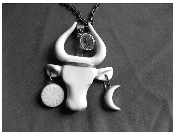
Fig. 7. Gh. Cojușnean. Set de podoabe (colecția MNAIM).

acest context, se folosesc scări de cele mai diferite forme și configurații, balustre, piese de mobilier, grile, sculpturi, alte articole decorative etc. Piesele posedă o încărcătură deosebită mai ales pentru percepția și educarea simțului frumuseții, dar sunt și foarte solicitate printre colecționarii de piese antice sau realizate „à la modern”, și care nu cedează practic impecabilității articolelor de giuvaiergerie. În acest context un rol deosebit îl dețin specialiștii care sunt preocupați nemijlocit de confecționarea unor asemenea articole, cum ar fi cazul designerilor (modelierilor), inginerilor, tehnologilor, metalurgilor ș.a.