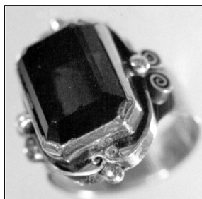
Fig. 3. Gh. Cojușnean. Inel-sigiliu. Argint, rauhtopaz. Colecție particulară.