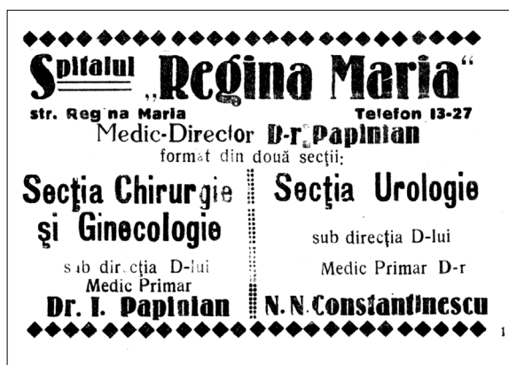
5. Casetă publicitară a Spitalului Regina Maria , amplasat în incinta Comunității Hârbovăț, publicată (Anuarul 1940, 111).

pentru zece paturi. Lucrările de construcție au costat aproximativ 20 mii ruble (БЖ 1907с, 3).