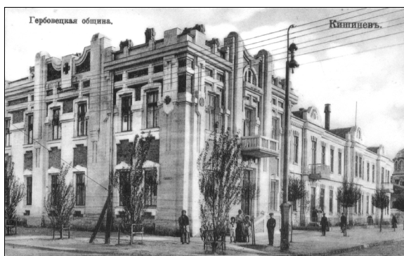
1. Carte poștală ilustrată Chișinău. Comunitatea Hârbovăț , înc. sec. XX. Editura Magazinul de carte și papetărie G.B. Șeinberg și fiul , Chișinău. Imagine alb-negru; necirculată.

După terminarea războiului, activitatea Crucii Roșii a fost mai modestă, până la începutul războiului ruso-japonez din 1904-1905, când principesa Sofia Urusova, soția guvernatorului Basarabiei în anii 1903-1904, cneazul S.D. Urusov (1862-