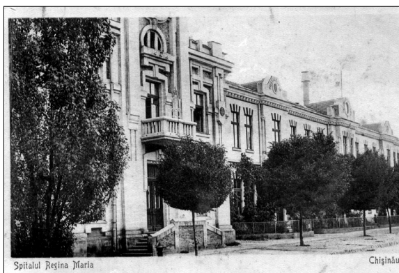
4. Carte poștală ilustrată Chișinău. Spitalul Regina Maria . Editată în perioada interbelică. Imagine alb-negru; necirculată.