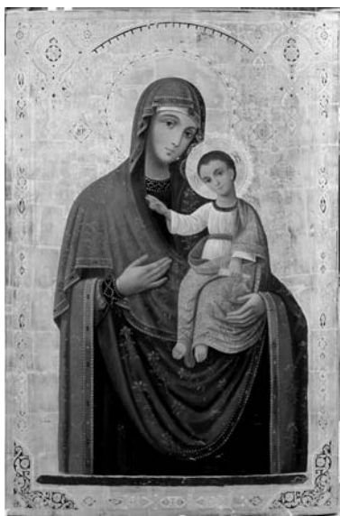
Fig. 13. Icoana Maicii Domnului de la Hârbovăț, colecția MNIM (FB-22918-3).