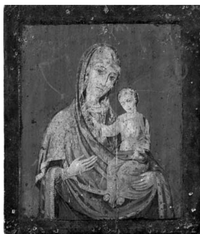
Fig. 17. Icoana Maicii Domnului de la Hârbovăț, colecția MNIM (FB-14736).