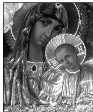
Fig. 25. Icoana Maicii Domnului de la Hârbovăț din Catedrala „Sfântul Vladimir” din or. Kiev, Ucraina.