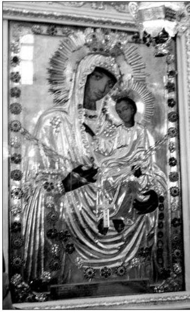
Fig. 2. Icoana Maicii Domnului de la Hârbovăț din mănăstirea „Înălțarea Domnului” din s. Japca, raionul Florești.