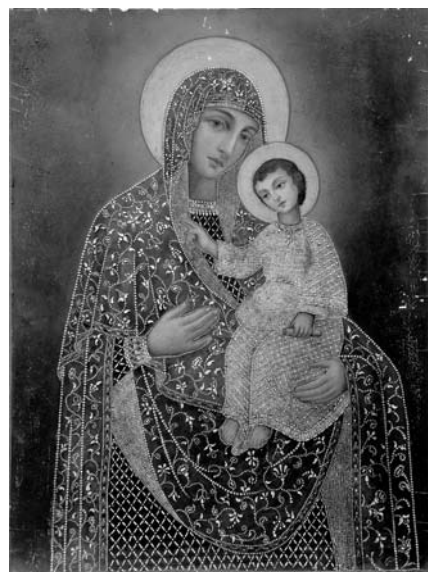
Fig. 15. Icoana Maicii Domnului de la Hârbovăț, colecția MNIM (FB-22918-44).

ternică a capetelor, de expresia blândă de pe fețe, mai ales fața Pruncului. Mântuitorul ține, de obicei, în mâna stângă sulul Scripturii, iar dreapta o întinde puternic spre Maica Sa, în gest de binecuvântare. Atitudinea Fecioarei, expresia de pe fața ei transmit nemuritoarea chemare „Faceți tot ce v-a zis El să faceți”. Ambii își îndreaptă privirile blânde și senine spre cel ce se roagă. Putem spune că, în iconografia Maicii Domnului de la Hârbovăț sunt îmbinate armonios trăsăturile a două modele mariologice distincte: Maica Domnului Hodighitria sau Îndrumătoarea și Maica Domnului Eleusa sau Mila Afectuoasă.