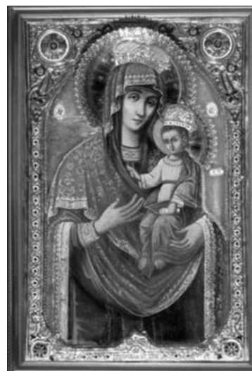
Fig. 21. Icoana Maicii Domnului „Trigorskaja” din mănăstirea „Schimbarea la față” din s. Trigorie, Ucraina.

cii Domnului de la Hârbovăț, în care Pruncul este înfățișat în poziție frontală (fig. 24). Proveniența timpurie a majorității iconografilor menționate ne face să credem că și datarea icoanei Maicii Domnului de la Hârbovăț ar putea aparține unei perioade mai timpurii.