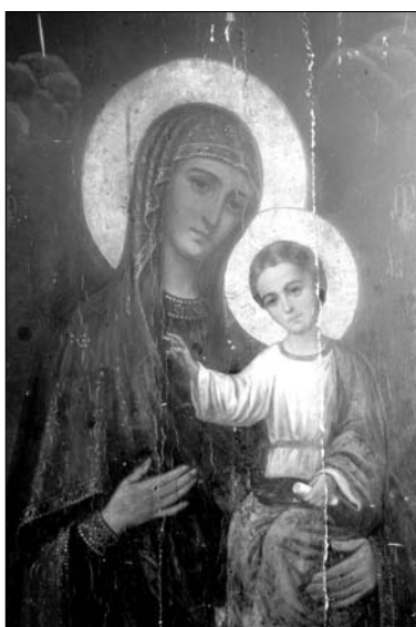
Fig. 11. Icoana Maicii Domnului de la Hârbovăț din Catedrala „Sfântul Mare Mucenic Teodor Tiron” din Chișinău (zugrav Ioan Protcenco).