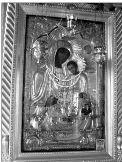
Fig. 8. Icoana Maicii Domnului de la Hârbovăț din mănăstirea „Sf. Arhanghel Mihail” din or. Odesa, Ucraina.