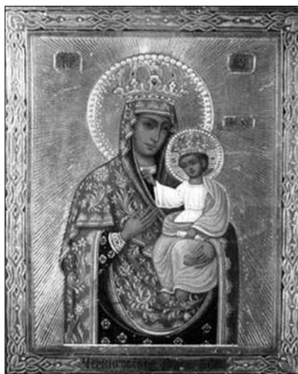
Fig. 20. Icoana Maicii Domnului „Cernigovskaja-Gefsimanskaja”, din Lavra „Sfintei Treimi” din Serghiev Posad, Rusia.