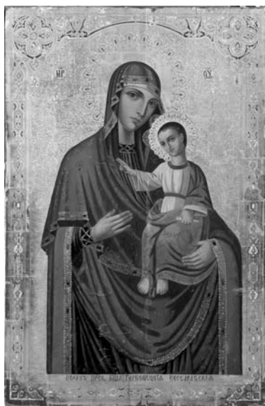
Fig. 14. Icoana Maicii Domnului de la Hârbovăț, colecția MNIM (FB-22918-11).