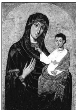
Fig. 22. Icoana Maicii Domnului „Bar-kolabovskaja” din mănăstirea „Înălțarea Domnului” din s. Bar-kolabovo, Bielorusia.

sește ușor tipul Maicii Domnului de la Hârbovăț, subiectul lor compozițional, exprimând particularitățile defnitorii ale acestuia. Constatând diversele expresii de pe fețele personajelor centrale din icoanele Maicii Domnului de la Hârbovăț, am clasificat icoanele examinate în trei grupe: 1. Fecioara și Pruncul sunt zugrăviți maiestuos, semeț, falnic, afecțiunea dintre ei este mai puțin accentuată (fig. 2, 10, 14, 15, 25); 2. Personajele centrale exprimă mai multă tandrețe, atitudinea reciprocă transmite milă deosebită (fig. 11, 13, 16, 18); 3. Chipul Maicii Domnului este redat sobru, hieratic, auster, privirea ei fixează eternitatea. (fig. 1, 4, 8). Icoanele din prima categorie sunt, de cele