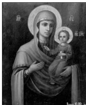
Fig. 24. Icoana Maicii Domnului de la Hârbovăț.