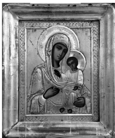
Fig. 16. Icoana Maicii Domnului de la Hârbovăț, colecția MNIM (FB-22642).

În sursele de referință, se relatează că, în anul 1858, când „s-a înlăturat ferecătura veche a icoa-