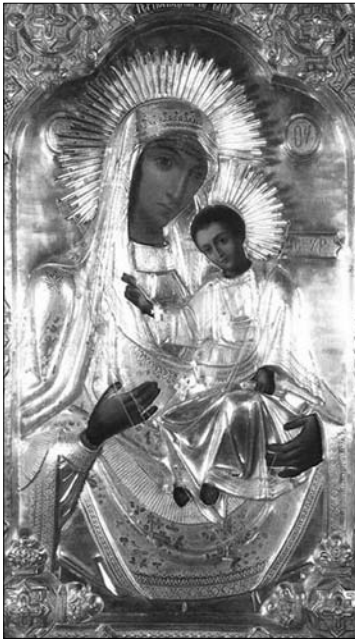
Fig. 1. Icoana Maicii Domnului de la Hârbovăț.