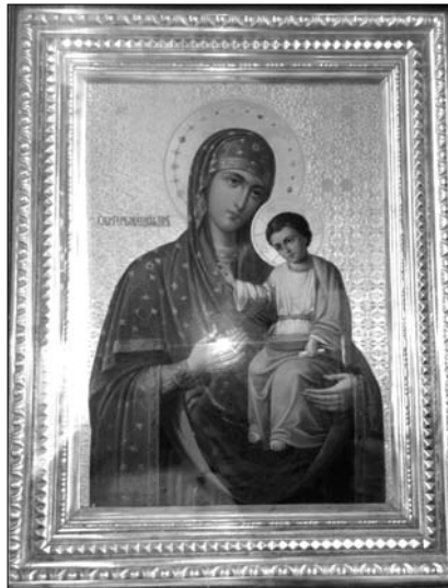
Fig. 5. Icoana Maicii Domnului de la Hârbovăț, din s. Sârcova, raionul Rezina.