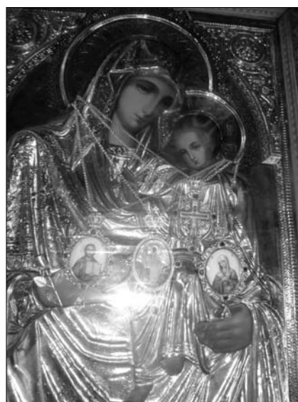
Fig. 12. Icoana Maicii Domnului de la Hârbovăț, de la mănăstirea „Adormirea Maicii Domnului” din satul Hârbovăț, raionul Călărași.

jos a icoanei se poate citi: „Maica Domnului din Gârbovăț” 7 . Executarea fină a chipurilor și modelarea inscripției de pe icoană ne face să credem că autorul acestei icoane poate fi Irineu Protcenco (1888-1953), un mare pictor ce-a activat în Basarabia, în perioada interbelică 8 .