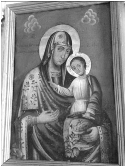
Fig. 4. Icoana Maicii Domnului de la Hârbovăț, din s. Sârcova, raionul Rezina.