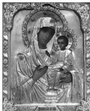
Fig. 23. Icoana Maicii Domnului din Lublin din mănăstirea „Minunea Sf. Arh. Mihail la Chones” din or. Moscova, Rusia.