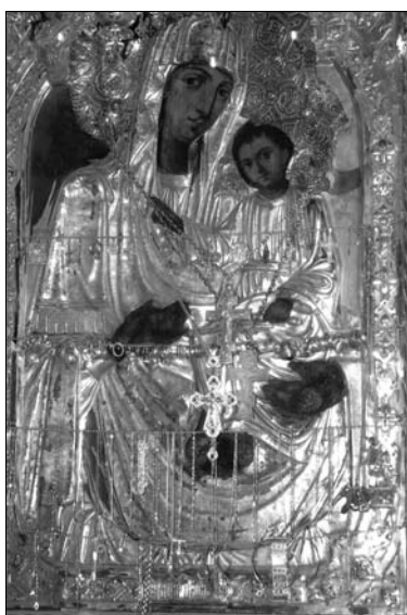
Fig. 10. Icoana Maicii Domnului de la Hârbovăț din Catedrala „Sfântul Mare Mucenic Teodor Tiron” din Chișinău.