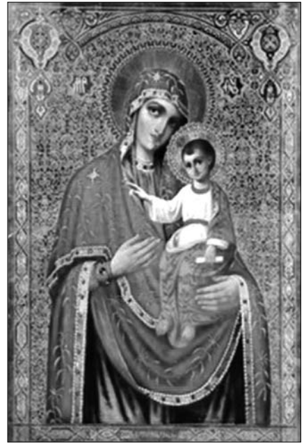
Fig. 3. Icoana Maicii Domnului de la Hârbovăț din mănăstirea „Înălțarea Domnului”, Noul Neamț, raionul Slobozia.