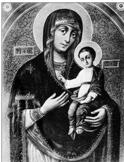
Fig. 19. Icoana Maicii Domnului „Ilinskaja-Cernigovskaja” din mănăstirea „Sf. Treime a Sf. Ilie” din or. Cernigov, Ucraina.