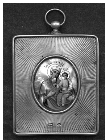
Fig. 18. Icoana Maicii Domnului de la Hârbovăț, colecția MNIM (FB-1540).