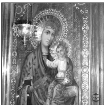
Fig. 7. Icoana Maicii Domnului de la Hârbovăț din Catedrala „Schimbarea la Față” din or. Bolgrad, Ucraina.