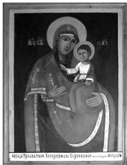
Fig. 9. Icoana Maicii Domnului de la Hârbovăț din biserica „Sf. Parascheva” din satul Furatovca, regiunea Odesa, Ucraina.