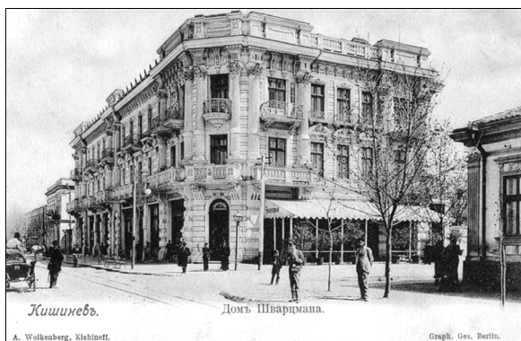
3. Casa Șvarțman, înc. sec. XX.

Spre sfârșitul sec. al XIX-lea orașul Chișinău devine unul din cele mai mari orașe din sud-vestul