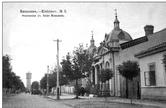
1. Cafeneaua Manikov , înc. sec. XX (carte poștală, MNIM).

economic, social și cultural. În acest context, instituțiile de agrement, care fac parte din categoria localurilor publice, sunt o parte componentă din viața cotidiană a locuitorilor orașului Chișinău și este o contribuție la reconstituirea modului de viață al locuitorilor urbei. Cum se odihneau orașenii, ce prezentau locurile de agrement în epocă, cum au fost acceptate de societate noile instituții de agrement, cine frecventa aceste localuri – iată doar câteva din întrebările care au servit drept punct de plecare în cercetarea literaturii de specialitate (care aproape este lipsă), a periodicelor de la sfârșitul sec. XIX - începutul sec. XX, a dosarelor de arhivă