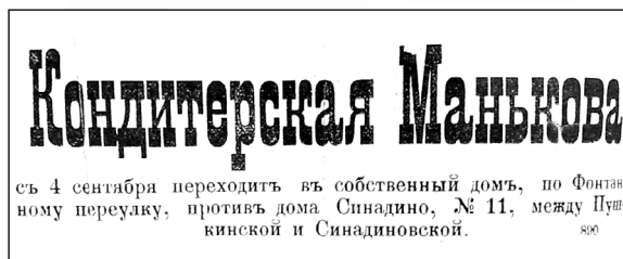
4. Casete publicitare ale Cafenelei Manikov , publicate în presa timpului (ziarele „Новое время”, „Друг”, „Бессарабская Жизнь”, „Юбилейный Сельскохозяйственный Календарь” etc.).

cafenele în case private sau să ia în arendă un edificiu pentru a fi utilizat ca loc de agrement, dar era obligatoriu ca la intrare, pe frontispiciu, să atârne firma etc. S-a purtat o corespondență între guvernatorul Basarabiei și Duma Orașenească cu privire la impozitarea proprietarilor și arendatorilor de localuri de odihnă 6 .