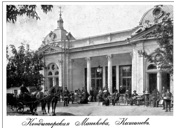
2. Cafeneaua Manikov , prima jumătate a sec. XX (carte poștală, colecție privată).

economic, social și cultural. În acest context, instituțiile de agrement, care fac parte din categoria localurilor publice, sunt o parte componentă din viața cotidiană a locuitorilor orașului Chișinău și este o contribuție la reconstituirea modului de viață al locuitorilor urbei. Cum se odihneau orașenii, ce prezentau locurile de agrement în epocă, cum au fost acceptate de societate noile instituții de agrement, cine frecventa aceste localuri – iată doar câteva din întrebările care au servit drept punct de plecare în cercetarea literaturii de specialitate (care aproape este lipsă), a periodicelor de la sfârșitul sec. XIX - începutul sec. XX, a dosarelor de arhivă