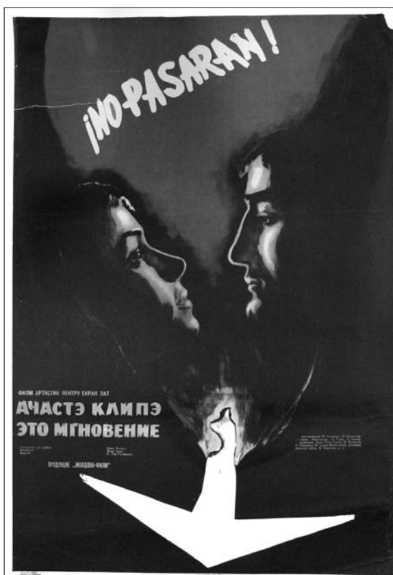
3. Afiș. Filmul artistic „Această clipă”, regie E. Loteanu, produs la Studioul Moldova-Film, 1968.

Moldova-Film , 1968, despre voluntarii din Basarabia care au luptat în Spania, în timpul războiului civil din 1936-1939. Filmul a luat Marele Premiu la Festivalul regional de filme de la Minsk, ediția a IX-a, 1969, și Premiul II pentru cel mai bun film istoric-revoluționar la Festivalul Unional de filme de la Minsk, ediția a IV-a, 1970. Pelicula are două afișe de format 58,0×88,5, care nu se deosebesc prea mult unul de altul. Sunt imprimate color cu imagine stilizată, includ distribuția rolurilor, text