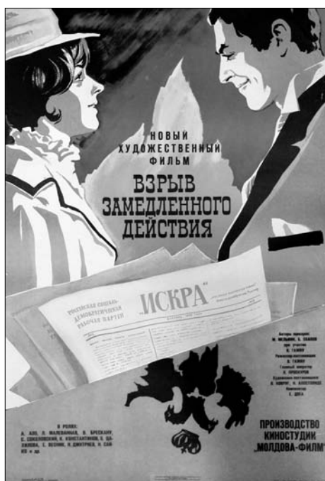
8. Afiș. Filmul artistic „Explozie cu efect întârziat”, regie V. Gagiu, produs la Studioul „Moldova-Film”, 1970.