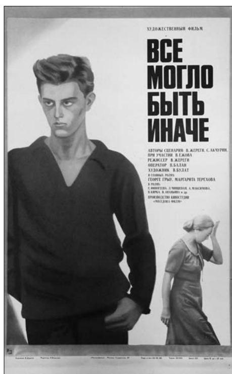
13. Afiș. Filmul artistic „Ar fi avut o altă soartă”, regie V. Jereghi, produs la Studioul „Moldova-Film”, 1982.

mensiuni 120×80 cm și este cel mai mare afiș din colecție 18 .