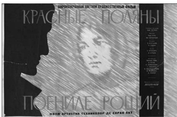
2. Afiș. Filmul artistic „Poienile roșii”, regie E. Loteanu, produs la Studioul „Moldova-Film”, 1966.

Un alt film de succes în regia lui E. Loteanu este și filmul artistic „Această clipă”, montat la Studioul