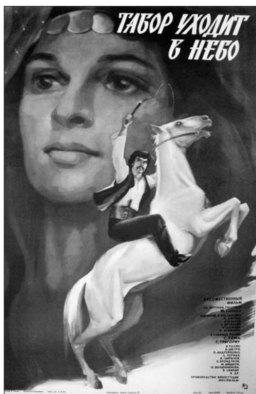
10. Afiș. Filmul artistic „O șatră urcă la cer”, regie E. Loteanu, produs la Studioul „Mosfilm”, 1976.