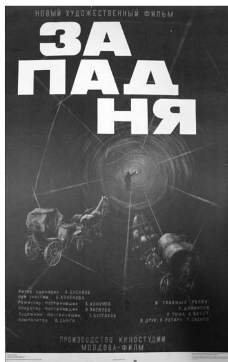
14. Afiș. Filmul artistic „Cursa”, scenariu A. Busuioc, regie B. Conunov, produs la Studioul „Moldova-Film”, 1989.

afișe de dimensiuni mari (85,0×53,5 cm), primul este semnat de M. Petrov, iar cel de-al doilea de I. Maistrovski, ambele imprimate la „Reclamfilm”, Moscova, într-un tiraj de 27.000 ex. 19 .