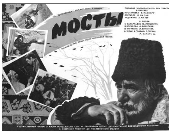
5. Afiș. Filmul artistic „Podurile” după romanul omonim de I.C. Ciobanu, regie V. Pascaru, produs la Studioul „Moldova-Film”, 1974.

Răsfoind colecția observăm că anii '70 ai sec. XX au fost cei mai productivi pentru Studioul Moldova-Film , numărul filmelor a crescut considerabil. La realizarea filmelor au fost antrenați un număr mare de actori moldoveni: M. Volontir, V. Ciutac, G. Grigoriu, I. Ungureanu ș.a., apar nume noi: V. Cupcea, S. Finiti, I. Arachelu, C. Târțău, I. Cucuruzac. Și-au început activitatea în calitate de regizori V. Brescanu, N. Ghibu, R. Vieru, V. Jereghi, V. Ioviță, B. Cononov. De menționat că în acești ani predomină peliculele cu tematică contemporană, unde în calitate de eroi apăreau numai fruntașii muncii socialiste și atotștiutorii secretari de partid. Despre acest lucru ne vorbesc afișele filmelor artistice produse la Studioul Moldova-Film : „Ofițerul în rezervă”, 1971, regie A. Mater, „Casă pentru Serafim”, 1973, regie F. Lupășcu și Ia. Burghiu, „Bărbații încăruneșc devreme”, 1974, regie V. Pascaru ș.a. 8