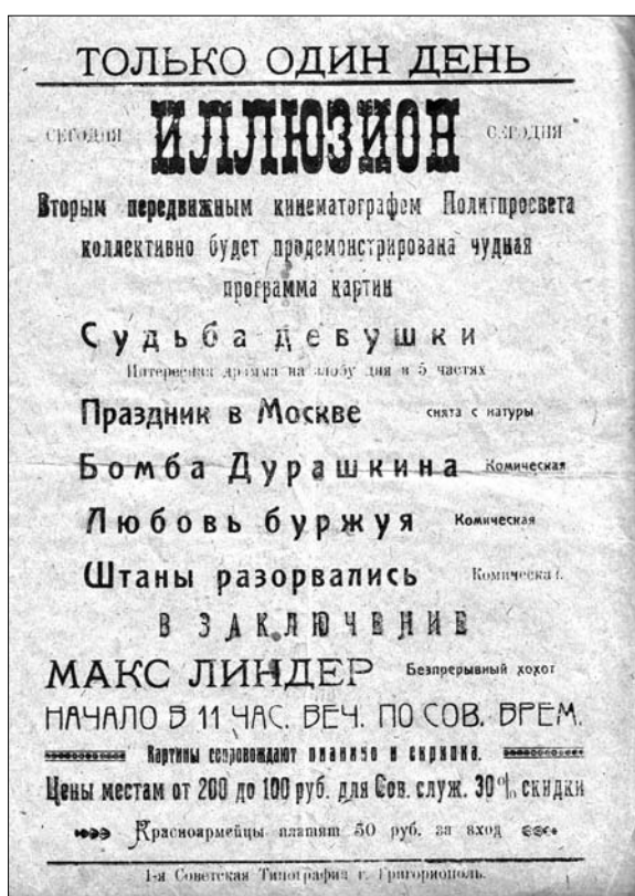
1. Afișul filmelor (filme mute) prezentate de Cinematograful ambulant „Iluzion”, Tiraspol, 1924.

Deoarece ambele modele de afișe le întâlnim pe toată perioada anilor '60-'80 ai sec. XX, vom încerca să caracterizăm (descriem) afișele din colecție cronologic și după tipul de film.