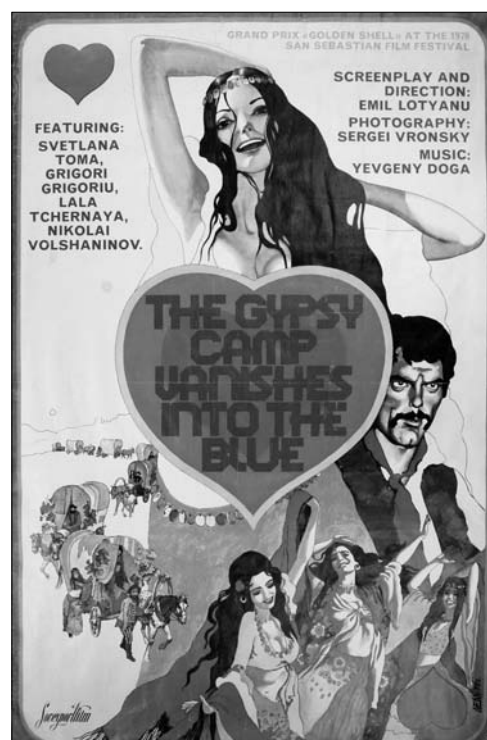
11. Afiș. Filmul artistic „O șatră urcă la cer”, regie E. Loteanu, produs la Studioul „Mosfilm”, 1976 (varianta de turneu).

Internațional de la San Sebastian (1976); premiul pentru cea mai bună regie la Festivalul internațional al celor mai bune filme din lume din Belgrad (Iugoslavia), 1977; premiul pentru cel mai bun film la Festivalul internațional din Praga (1977), Diploma de onoare la Concursul de realizare tehnică a filmelor în cadrul Congresului XI al UNIA-TEK din Paris, 1979. „O șatră urcă la cer” este pelicula care l-a consacrat pe regizorul moldovean Emil Loteanu în cinematografia sovietică și care i-a adus recunoaștere mondială. Primul afiș este semnat de A. Ulîmov și are în prim-plan imaginea actorilor G. Grigoriu și S. Toma, distribuiți în rolurile centrale. Este un afiș color, bogat în informație, cu distribuția rolurilor, text în limba rusă, imprimat la „Reclamfilm”, Moscova, într-un tiraj de 147.000 ex., dimensiuni 54×86 cm 17 . Cel de-al doilea reprezintă varianta internațională a afișului (afișul de turneu). Afișul este de format mare, foarte colorat cu secvențe din film. Denumirea filmului și distribuția rolurilor sunt imprimate în limba engleză. Autorul, tirajul și tipografia nu se indică. Conține inscripția „Sovexportfilm”, di-