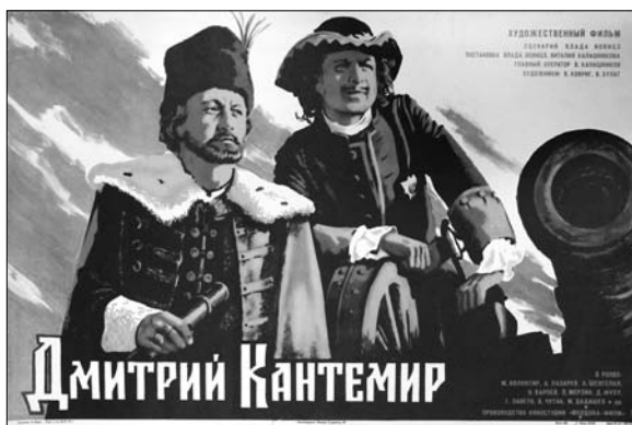
7. Afiș. Filmul artistic „Dimitrie Cantemir”, regie Vl. Ioviță și V. Kalașnikov, produs la Studioul Cinematografic „Moldova-Film”, 1974.

Menționăm aici și cele două afișe ale filmului artistic „Dimitrie Cantemir” în regia lui Vlad Ioviță și Vitalie Kalașnikov, produs la Studioul Moldova-Film în 1974. Pelicula a obținut Diploma pentru oglindirea temei istorice la Festivalul Unional de Film din Baku (ediția a VI-a, 1974). Primul afiș făcut pentru premiera filmului include secvențe din film, alb-negru, distribuția rolurilor și o scurtă descriere a filmului, text în limba rusă, autorul afișului nu se cunoaște, imprimat la tipografia din or. Bender într-un tiraj de 12.000 ex., dimensiuni 60×84 cm 11 . Cel de-al doilea afiș, semnat de pictorul N. Celișceva, este imprimat la „Reclamfilm”, Moscova, în 35 000 ex. de dimensiuni mai mici 39,5×55,0 cm, text în limba rusă, ambele afișe făcute în același an 12 . Observăm că afișul premierei este mai puțin atractiv. Cel de-al doilea afiș este colorat și foarte impunător prin imaginea sa, distribuția rolurilor fiind trecută pe planul doi.