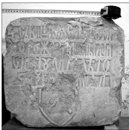
Рис. 4. Плита 1454 г. Фонды Херсонского областного краеведческого музея /без номера.

Судя по зубцам, первоначально плита использовалась как часть архитектурного сооружения ранневизантийского или же позднеантичного периода. К мастеру XV в. она могла попасть в качестве заготовки из руин античной Тире, расположенной в районе крепости.