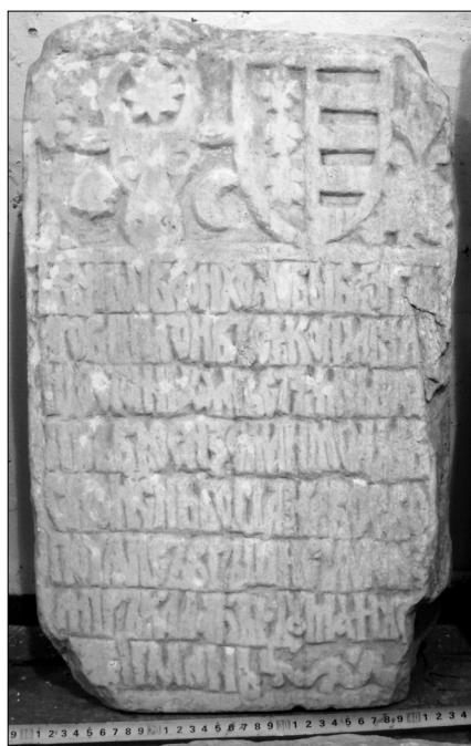
Рис. 6. Плита 1478-1480 гг. Фонды Херсонского областного краеведческого музея /без номера.