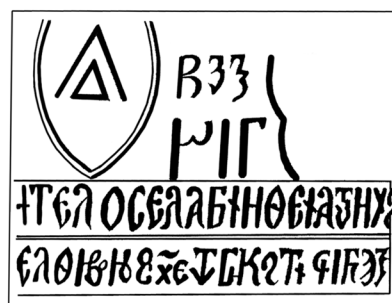
Рис. 2. Прорисовка плиты 1452 г. с архивного листка 1819 г. (по Войцеховский 1972, рис. 3).

Плита 1440 г. (рис. 3). Располагалась на южном фасаде разделительной стены крепости, у Средних ворот (башня №24), соединяющих между собой два двора (рис. 1). Размеры: длина – 1,1 м, ширина – 0,51 м, толщина – 0,19 м. Вырезана из плотных сортов белого известняка (сарматской породы?). В тексте идет речь об окончании строительства «каструма» во времена правления молдавского господаря Стефана II.