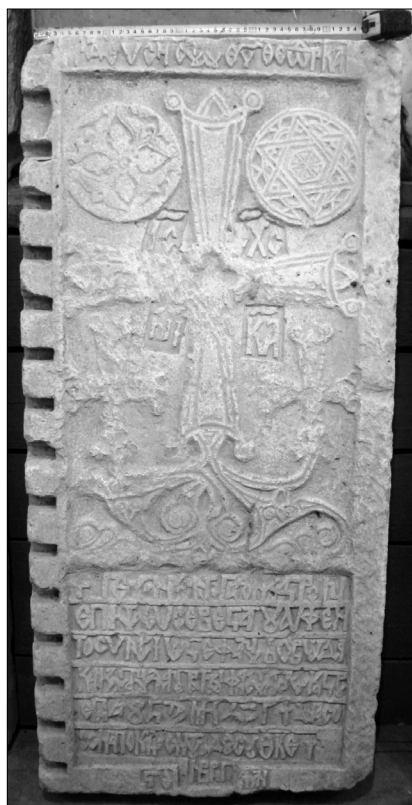
Рис. 3. Плита 1440 г. Фонды Херсонского областного краеведческого музея /без номера.

Плита хорошо отесана со всех сторон, в том числе и с тыльной. Характер обработки всех боковых поверхностей плиты, наряду с тщательной пригонкой отдельных деталей, мог предполагать также ее установку в готовую нишу, т.е. по завершении строительных работ (ниша сохранилась). На тыльной стороне, в верхней части – отверстие для крепежа на стену. Левый торец украшен цепочкой квадратных зубцов по всей длине плиты. Причем в верхней части крайний из зубцов обрывается на половине своей ширины – результат подтепки 1440 г. Это говорит о вторичном использовании плиты.