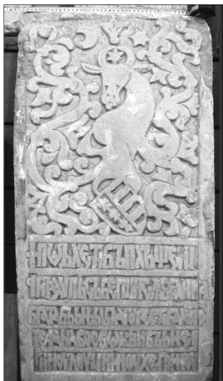
Рис. 5. Плита 1476 г. Фонды Херсонского областного краеведческого музея /без номера.

«Woevoda». Также отмечены полугроши, на которых рядом со щитом обозначена литера «А», возможно обозначающая имя господаря – Александр (Бырня, Русев 1999, 183, 187-188).