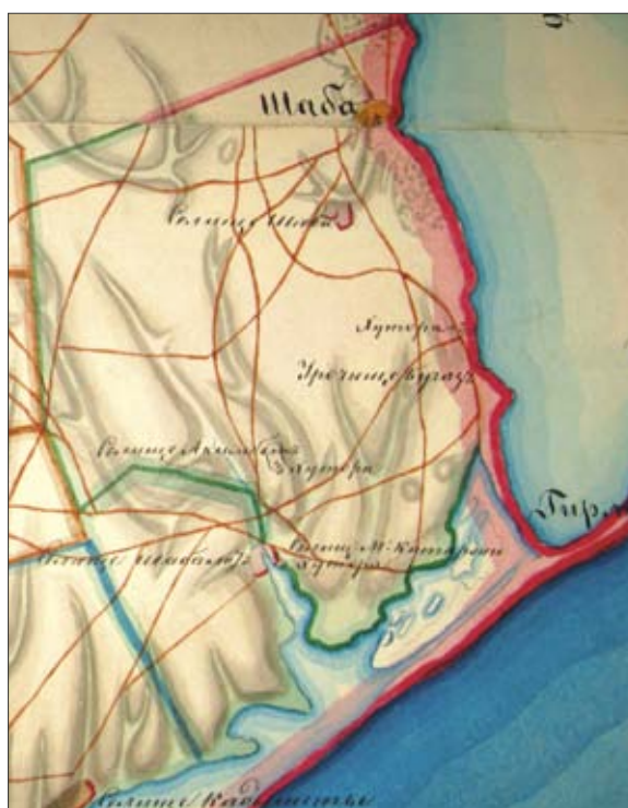
Рис. 1. Земельные участки сел Шаба и Шабалат на карте Бессарабии 1828 г.

Искомый нами земляной вал отмечен на протяжении около 5,5–5,8 км, лежащим примерно по линии С-СВ–Ю-ЮЗ вдоль края коренного берега Будакского (Шабалатского) лимана от юго-восточной окраины современного села Беленькое до района у северо-восточной окраины с. Прибрежное, где в наше время параллельно друг другу проходят шоссейная