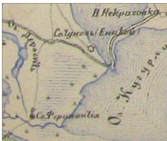
Рис. 10. Укрепление у с. Новосельское на карте дельты Дуная 1860-х гг.

Вторым объектом является укрепление, которое находилось на мысу, образованном правыми берегами озер Ялпуг и Кугурлуй, примерно в 300-350 м к западу от с.Новосельское (Сатул-Ной). Факт его существования мы можем обосновать несколькими топографическими картами. Первая из них точно не атрибутирована и датирована приблизительно 1860-ми гг. На ней можно увидеть довольно крупное, шестиугольное в плане укрепление и ведущую к нему с СЗ дорогу (рис. 10). На следующем документе из серии «Карта части Балканского полуострова, обнимающая весь театр войны 1877-1878 гг.» (М 1 : 126 000; лист I-10) обозначено уже «Бывш. (шее) укр. (епление)» (рис. 11).