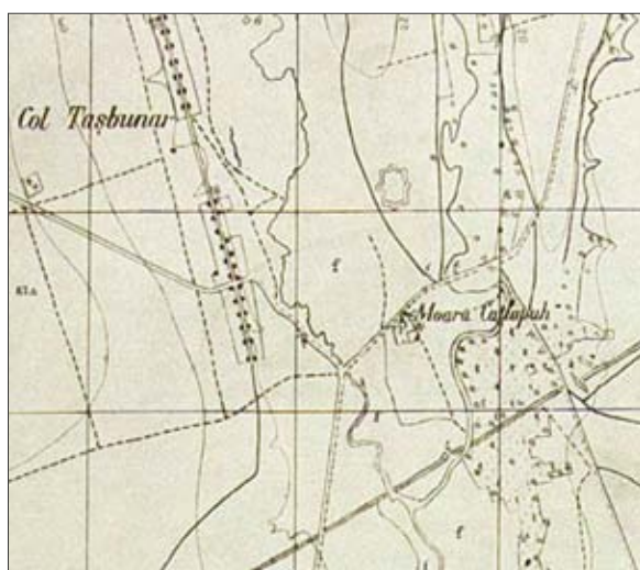
Рис. 9. Село Ташбунар и часть Нижнего Траянова вала на немецкой карте 1941 г.

сколько иную планиграфию, не квадратной, а вытянутой прямоугольной формы (рис. 9).