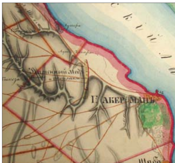
Рис. 5. Земельный участок г. Аккермана на карте Бессарабии 1828 г.

Прежде чем перейти к поиску места нахождения этого вала, скажем, что история переселения некрасовцев из-за Дуная и судьба Измаильского Николаевского старообрядческого монастыря, упраздненного уже в мае 1829 года за «подозрения в отношениях с турками и укрывательстве беглецов из-за Дуная и прочем», в общих чертах хорошо известны