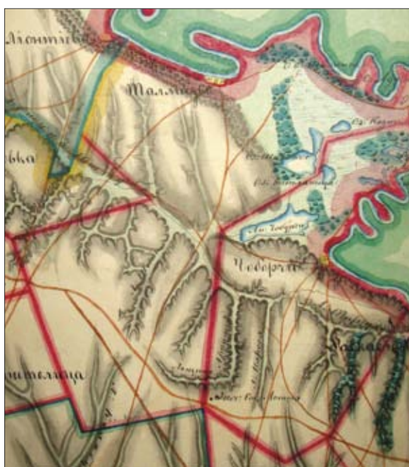
Рис. 4. Земельные участки сел Талмазы и Чобручи на карте Бессарабии 1828 г.

с. Шабо и г. Аккермана, то можно вычислить, что длина последнего могла составлять в 1827 г. приблизительно 4,0-4,5 км.