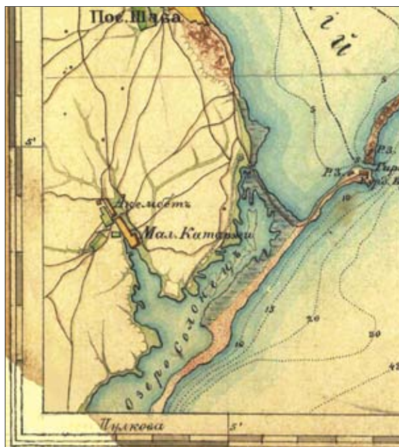
Рис. 3. Часть Нижнеднепровского (Змеевого) вала на «Специальной карте» А.П. Чиркова 1864 г.

державшихся в «Статистическом описании Бессарабии». В связи с этим нами был проведен анализ характеристик всех земельных дач, по которым мог проходить Нижнеднепровский вал с учетом того, что на сегодня картографическими материалами обеспечен его следующий маршрут (с СЗ на ЮВ): от Олонешт до Паланки (отдельными участками) и от Паланки до Малоги (сплошным отрезком) (Сапожников 2011, 221-222, рис. 9-12).