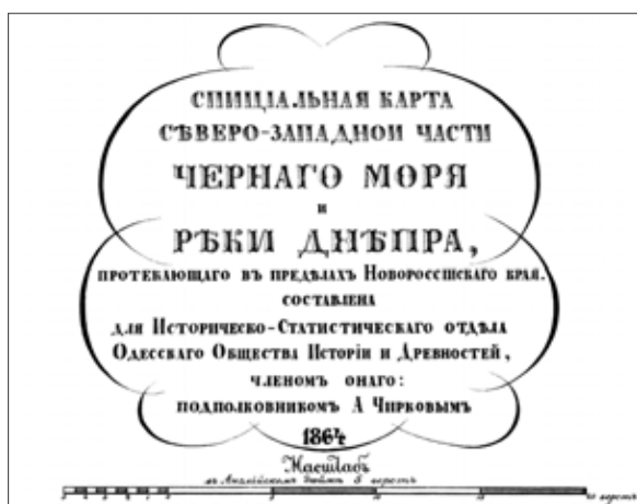
Рис. 2. Фрагмент «Специальной карты» А.П. Чиркова 1864 г.