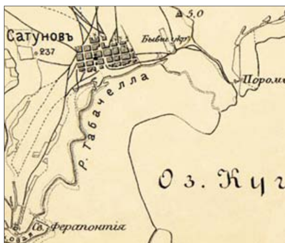
Рис. 11. Укрепление у с. Новосельское на «Карте части Балканского полуострова, обнимающей весь театр войны 1877-1878 гг.».