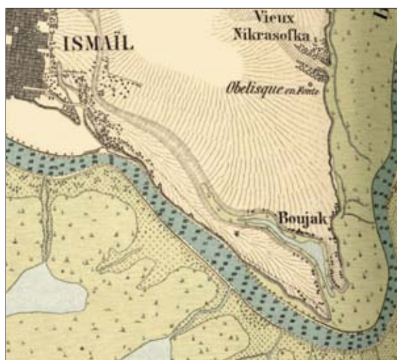
Рис. 7. Район Монастырского мыса на карте дельты Дуная Европейской дунайской комиссии 1887 г.

«Russland – Bessarabien» (М 1 : 25 000; лист 5754 «Necrasovca Veche» 1941 г.; рис. 8). Обратим внимание на то, что на обоих приведенных фрагментах интересующее нас урочище имеет название «Буджак» – то есть угол или треугольник. Сам мыс от места своего сужения имеет ориентацию почти строго по линии СЗ–ЮВ, длину до 3,1-3,2 км, наибольшую ширину до 0,75 км, высоту по гребню от 9 до 11 м и обрывистый берег со стороны Килийского гирла Дуная (рис. 8). В настоящее время он ограничен с северо-запада территорией бывшего Измаильского консервного завода, а на всей стрелке мыса расположен комплекс сооружений Измаильского целлюлозно-картонного комбината. К счастью, центральная и северо-западная части мыса пока в основном доступны для поисковых работ и стационарных раскопок.