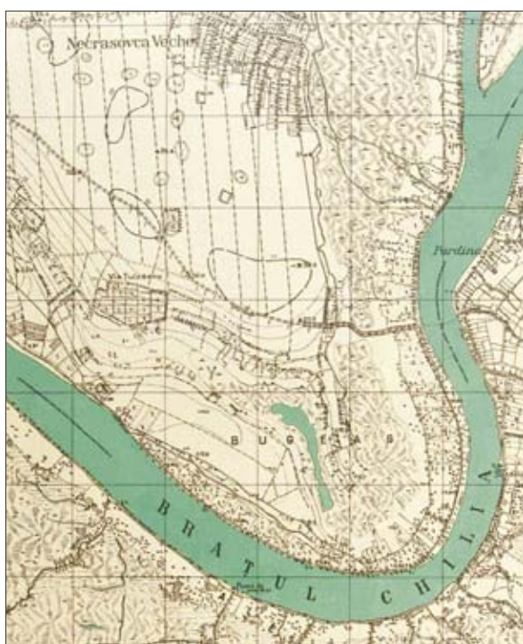
Рис. 8. Район Монастырского мыса на немецкой карте 1941 г.

раннем справочнике отмечено «поселение на территории консервного комбината» в районе балки Копаной (Гудкова и др. 1991, 62), которая впадает в оз. Кривое.