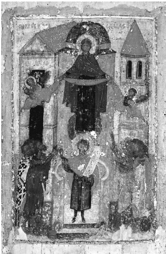
Fig. 3. Icoana Acoperământul Maicii Domnului, Suzdal, 1360, mănăstirea Acoperământul Maicii Domnului.

se păstrează în prezent în Galeria „Tretiakov” (Государственная 1995, 121). Trebuie să menționăm că în acest model lăcașul zugrăvit amintește de biserica Vlahernelor cu acoperișul în două panțe și cupolă rotundă. Acest tip se va repeta și pe icoanele din sec. al XV-lea din același lăcaș. În cel de-al doilea tip, supranumit de Novgorod, Acoperământul Fecioarei este susținut de îngeri, ea fiind redată, în acest caz, în interiorul bisericii, deasupra ușilor împărătești, această icoană provenind din mănăstirea Zverin, din Novgorod și datează din anul 1399 (fig. 4). Arhitectura din icoană prezintă o biserică cu naosul trilobat și cu cinci turle în formă de cupole. Ambele versiuni au și caracteristici comune: pe ele, în partea de jos, fiind reprezentat Sf. Andrei cel Nebun într-o Hristos, cu discipolul său Epifanie.