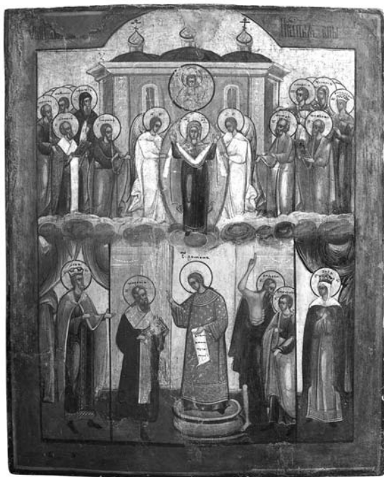
Fig. 7. Icoana Acoperământul Maicii Domnului, Rusia, sec. al XIX-lea, MNIM (FB-23384-4).

cioară, încadrată în mandorla, ajutând-o, parcă, să ridice maforionul. De o parte și de alta a îngerilor sunt reprezentați mai mulți apostoli și sfinți făcători de minuni – toți zugrăviți în nimbul slavei lor. Printre ei se disting Sf. Ioan, Sf. Nicolae, Sf. Nichita, Sf. Efim, Moisei precum și Sff. Petru și Pavel, Sf. Ecaterina, Sf. Pelaghia, Sf. Mare Mucenic Gheorghe. Ei își îndreptă privirile spre Maica Domnului, care prin gestul mâinilor ridicate, cu palmele îndreptate în sus, aduce slavă Fiului său, pictat într-un medalion auriu. Mântuitorul ține Evanghelia și binecuvântează alaiul sfinților și toată mulțimea prezentă la minunea ce se săvârșea în biserica Vlaherne. În partea de jos, în mijlocul icoanei, pe amvon, este zugrăvit Roman Melodul îmbrăcat în stihar de diacon, cu un filacter în mâna stângă, pe care este scris Condacul de Crăciun. În partea dreaptă sunt reprezentați patriarhul Constantinopolului Tarasie (784-806) și împăratul Leon (866-912), pe timpul căruia a avut loc minunea, iar în partea stânga – Sf. Andrei cu ucenicul său Epifanie, precum și împărăteasa Zoe (978-1050), cea care a fost tămăduită de boală grea prin atingerea Brăului Maicii Domnului. În partea superioară a chenarului, se citește inscripția „Образ Покрова Пресвятой Богородицы”. În nimburile s-au înscris numele personajelor, doar numele lui Roman Melodul s-a înscris în afară.