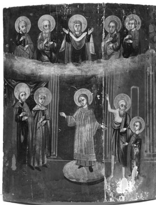
Fig. 6. Icoana Acoperământul Maicii Domnului, Moldova, 1871, MNIM (FB-23611).

În interiorul unei biserici, în centru, pe amvon, este reprezentat Roman Melodul, cu sacos roșiat-cafeniu și stihar verde-gri, cu mâinile întinse spre cei prezenți în biserică. La dreapta sunt înfățișați împăratul și împărăteasa, care își exprimă admirația ascultând propovăduirea Melodului, sentiment redat de expresia fețelor și gestul