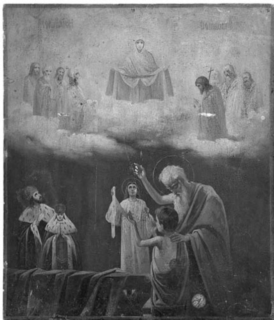
Fig. 8. Icoana Acoperământul Maicii Domnului, Basarabia, înc. sec. al XX-lea, biserica „Sf. Parascheva” din s. Zgurița, raionul Drochia, MNIM (FB-22918-115).

Pe suprafața icoanei se disting două registre: cel superior îl ocupă Maica Domnului cu un alai de sfinți conduși de Ioan Botezătorul și Ioan Teologul. Fecioara, îmbrăcată în chiton verde-albastru și maforion alb-gălbui, ține în mâinile desfăcute Acoperământul alb-albastru. Capul ei este încadrat de un nimb slab conturat, în părțile laterale ale căruia se poate citi „Maica - Domnului”. Sub norii care despart cele două registre compoziționale sunt reprezentate mai multe personaje. Printre acestea se află Sf. Andrei care îi arată ucenicului său Epifanie să privească și el la apariția miraculoasă a Sfintei Fecioare. Acesta ridică mâinile în semn că Fecioara i se arătase și lui. Lângă ei, în veșminte albe, cu ochii ridicați în sus este zugrăvit Roman Melodul, care ține în mâini un omofor cu mai multe cruce aurite pe el. În stânga lui sunt înfățișați împăratul Leon cel Înțelept (886-911) și soția sa Teofana. El privește mirat în sus, mâna dreaptă ridicând-o la nivelul pieptului, împără-