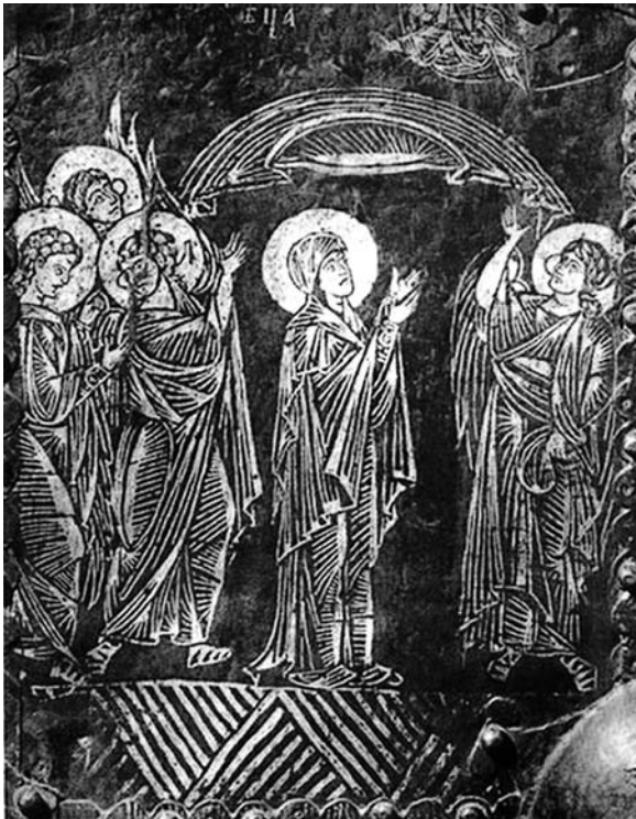
Fig. 2. Icoana Acoperământul Maicii Domnului, Suzdal, sec. al XIII-lea, Catedrala Nașterea Maicii Domnului.