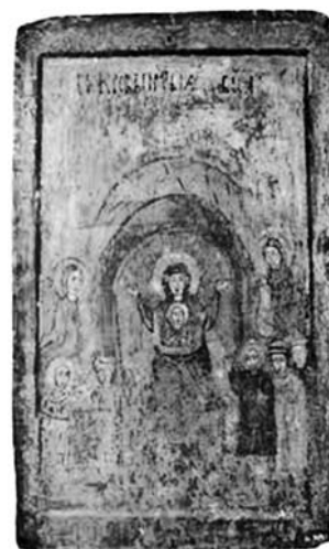
Fig. 1. Icoana Acoperământul Maicii Domnului, Galiția, sec. al XII-lea.

Dintre cele mai timpurii imagini rusești ale acestui tip iconografic se remarcă cea atestată la Suz-