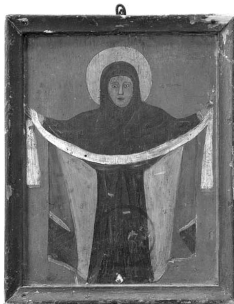
Fig. 9. Icoana Acoperământul Maicii Domnului, Basarabia, anii '20-'30 ai sec. al XX-lea, MNIM (FA-10538-19).