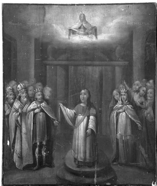
Fig. 9. Icoana Acoperământul Maicii Domnului, Basarabia, anii '20-'30 ai sec. al XX-lea, MNIM (FA-10538-19).

Pe icoană, pe un fundal verde-albastru este reprezentată Maica Domnului până mai jos de genunchi ținând pe mâinile desfăcute în părți brâul alb cu marginile roșii. Născătoarea de Dumnezeu poartă maforion rubiniu cu bordură aurită și față interioară de nuanță roză, precum și chiton albastru cu mâneculele aurite. Este redată cu nimb aurit. Icoană nu conține nici o inscripție.