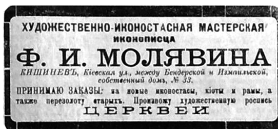
17. Caseta publicitară a atelierului de pictare a icoanelor al lui F.I. Moleavin, publicată în ziarul Друг nr. 15, 1914.