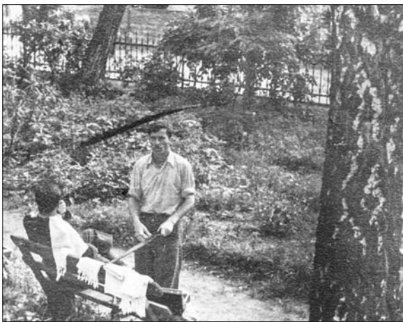
Foto 5. Frizeria în aer liber de la Securenii.

de trupele rusești aflate în retragere. Batalionul 15 Vânători de Munte a primit misiunea de curățire a câmpului de bătălie, iar după ce a străbătut orașul de la sud la nord a înălțat tricolorul pe turnul Cetății Hotinului 21 . Această victorie consfințează