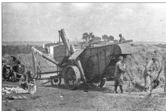
Foto 8. Soldații români prelucrând grâul la Obodovca.