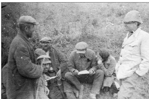
Foto 7. Ucrainenii citind manifeste.