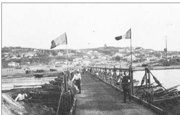
Foto 13. Podul de pontoane peste Bug.