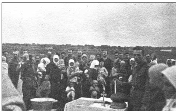
Foto 15. Zaredarovca. Preotul brigăzii botează copiii născuți sub regimul bolșevic.

ză copiii născuți sub regimul bolșevic (foto 15 37 ). Localnicii apar adeseori alături de soldații și ofițerii români fără însă a lăsa impresia că fotografia este rezultatul unei acțiuni de constrângere, așa cum este cazul imaginilor în care apar grupurile de prizonieri. În timpul staționărilor pe durata a două sau mai multe zile postul de comandă era întotdeauna instalat în clădirea școlii din localita-