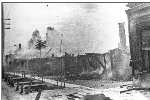
Foto 2. Orașul Noua Suliță incendiat de armatele rusești.

ții a fost „aruncat” peste râul Prut 16 . După ce pionierii români au refăcut podul distrus de armata rusă, materialul logistic al Diviziei 2 Munte a fost transportat pe pod, iar trupele pe bărci și portițe. În drumul spre Hotin Armata Română a traversat orașul Noua Suliță distrus prin incendiere de trupele ruse aflate în retragere (foto 2 17 ). În zilele de 6-7 iulie Divizia 2 Munte (întărită cu cele două Divizioane de artilerie grea ale Corpului de Armată) și Divizia de Cavalerie au dus lupte crâncene pentru cucerirea orașului Hotin. În dimineața zilei de 8 iulie toate unitățile sovietice rămase între Hotin și Nistru s-au predat după ce distruseseră o mare parte a materialelor și omorâseră caii care nu au putut fi evacuați peste Nistru. 18 Armata Română a capturat câteva mii de prizonieri (foto 3 19 ) și zeci de camioane (foto 4 20 ) care nu au putut fi distruse