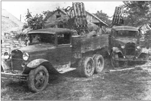
Foto 3. Armament capturat de Armata Română la Hotin.