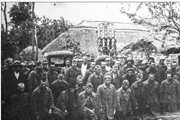
Foto 4. Prizonieri ruși la Hotin.