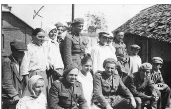
Foto 14. Țăranii ruși descriu suferințele din timpul regimului bolșevic.