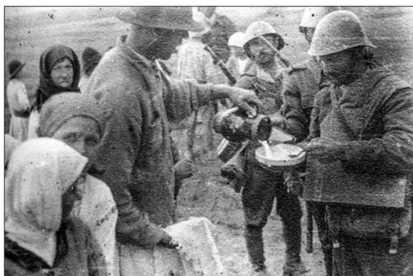
Foto 1. Tureatca. Soldații români primesc lapte din partea țăranilor bucovineni.

În intervalul 22 iunie - 1 iulie 1941 s-au desfășurat acțiuni militare locale în zona Prutului pentru ca în zorii zilei de 2 iulie să se treacă la ofensivă pe întregul front românesc. După atacul asupra frontierei, în 3 iulie 1941, la intrarea în localitatea Tureatca (azi Turyatka) populația bucovineană a întâmpinat Armata Română cu flori, lapte și pâine (foto 1 15 ). Trupele au traversat Ținutul Herța pe direcția nord-est, prin satele Târnauca (azi Ternavka) și Molnița (azi Mohylivka), ajungând pe malul drept al Prutului. Toate podurile între Cernăuți și Noua Suliță fiind distruse, Diviziile Corpului de Munte, aflate în linia întâi, au trecut la refacerea acestora cu mijloacele proprii și cu ajutorul materialelor din zonă. Dacă Divizia 1 Munte a trecut Prutul fără întârziere, Divizia 2 Munte a fost nevoită să intervină cu toată artileria, în ziua de 4 iulie, în ajutorul Batalioanelor de avangardă, care au respins până seara inamicul din zona Herța. Acesta mai stăpânea doar un mic „cap de pod” la sud de Noua Suliță și care în cursul nop-