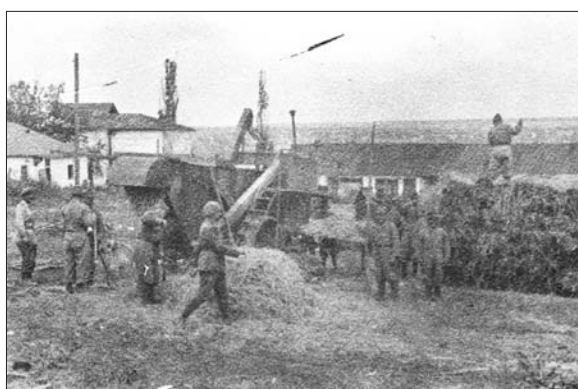
Foto 9. Soldații români prelucrând grâul la Obodovca.