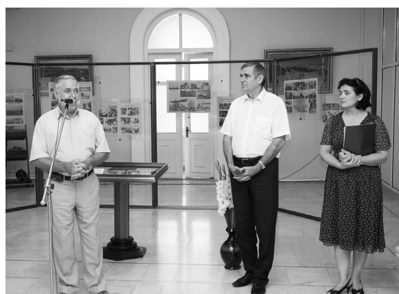
Secvențe de la vernisarea expoziției