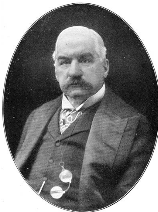
Фото 7. Портрет Дж. Пьерпонт Моргана.