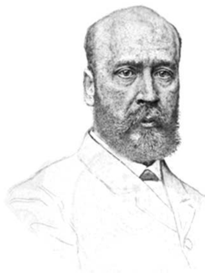
Фото 2. Портрет А.В. Звенигородского.

Весьма любопытная характеристика А.В. Звенигородского содержится в «Дневнике» Государственного секретаря А.А. Половцова, который сделал следующую запись 14 марта 1883 года: «Сверхштатный помощник ст[атс]-секретаря Звенигородский, не получающий жалованья, просит отставки, но желает получить и чин тайного советника и пенсию за то, что, будучи выгнан из Конторы цесаревича, ничего не делал в Государственной Канцелярии» (Половцов 1966, 57). В переписке сотрудника Императорской Публичной библиотеки В.В. Стасова (большой друг А.В. Звенигородского и его соратник во многих проектах) имеется замечание о характере коллекционера. Отвечая издателю «Русской музыкальной газеты» Н.Ф. Финдейзену на просьбу о возможности покупки книги об истории издания