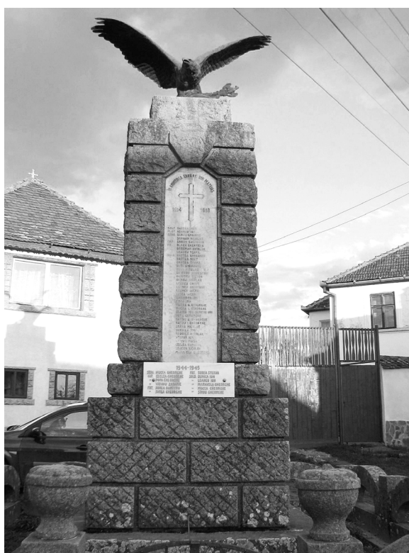
Foto 3. Monumentul astăzi.