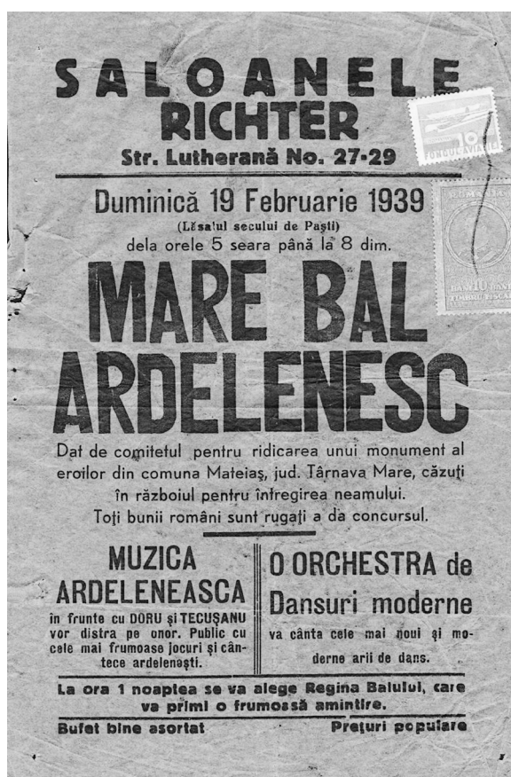
Foto 1. Afiș de bal.

și încredințează comitetului din București sarcina de a achiziționa vulturul și plăcile de bronz 14 . Monumentul din piatră urma să fie o combinație a două modele și trebuia să aibă 4 m înălțime, un postament format din trei rânduri și o placă de marmură cu cruce.