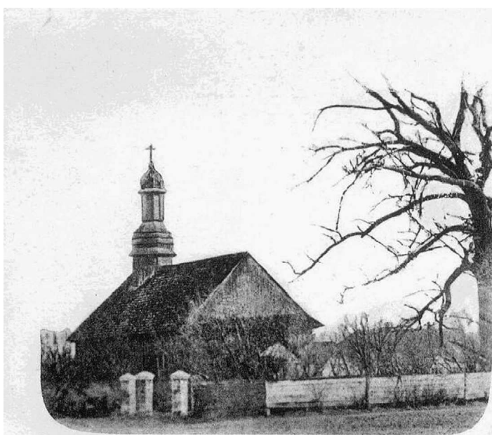
КЕДИДАНЫ. Православная церковь Преображения, построенная Мариєю Радзивилль (Могиланка) вт. 1648 году. (Нынѣ упраздненная).