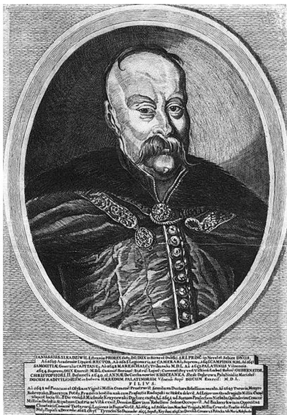
Fig. 2. Janusz Radziwiłł, soțul Mariei (Lupu) Radziwiłł (după Leybowicz 1758).

perioada căsătoriei și văduviei Mariei (Lupu) Radziwiłł (mijl. anilor '40 - sf. anilor '50 ai secolului al XVII-lea). Scrisorile Mariei Lupu sunt un izvor unic de epocă din mai multe puncte de vedere – conținut, stil, formă etc. Cel mai important e faptul că acestea sunt scrisori originale de la mijlocul secolului al XVII-lea, alte scrisori sau însemnări ale femeilor din această epocă practic nu s-au păstrat, cu mici excepții. Din scrisorile depistate constatăm că Maria (Lupu) Radziwiłł avea o libertate economică deplină față de soțul ei, își administrea afacerile financiare și economice privitoare la bisericile și mănăstirile ortodoxe.