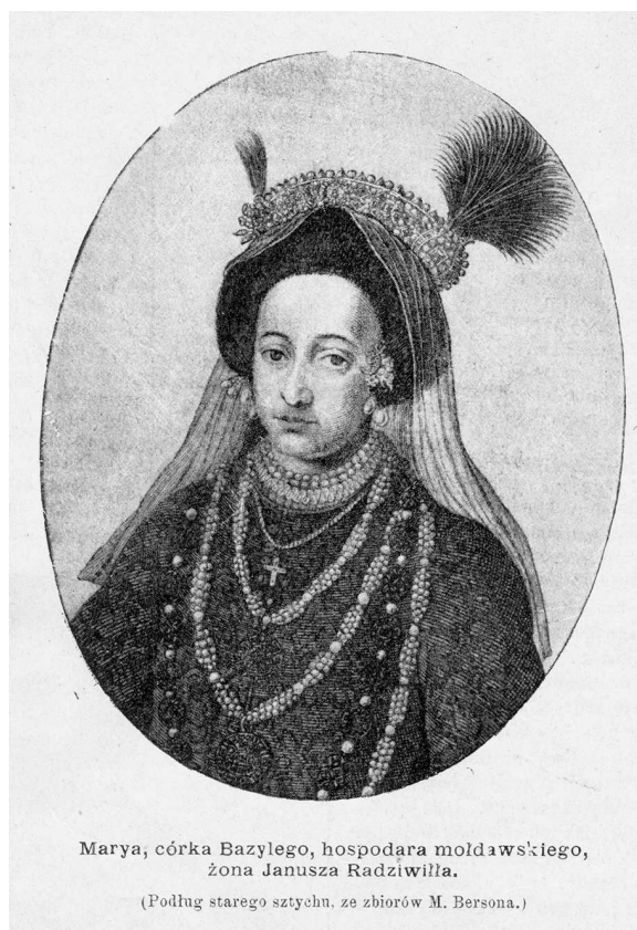
Fig. 4. Maria (Lupu) Radziwiłł.

În Varșovia, la 3 martie 1645, imediat după nuntă, Maria (Lupu) Radziwiłł primește de la regele polonez Władysław IV, în calitate de cadou de nuntă, trei concesiuni, ce îi acordau dreptul de proprietate afectat de usufruct viager asupra comitatelor, care aparțineau soțului său, Janusz Radziwiłł: comitatul Sejwy al sectorului Grodziec, Bystrzyca din provincia (regiunea) Lituaniană, precum și Retów na Żmudzi (Wasilewski 1989, 292-293).