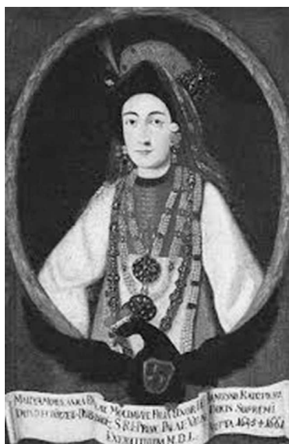
Fig. 1. Maria (Lupu) Radziwiłł (autor necunoscut, după lucrarea lui Matthäus Merian (junior). Dział Dokumentacji Wizualnej i Digitalizacji. Muzeum Narodowe w Warszawie).