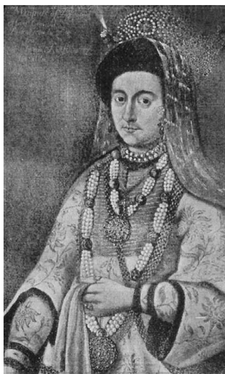
Fig. 8. Portretul Mariei (Lupu) Radziwiłł (autor necunoscut) ( https://www.google.MariaRadziwiłł ).

galbeni din moșiile de la Zabłudow. În altă diată a lăsat 100 000 galbeni la două mănăstiri din Vilnius – una pentru călugări și una pentru maici, și pentru școlile care erau pe lângă aceste mănăstiri (adică ea era tutorele acestor școli - L.Z. ) (Wasilewski 1987, 400) (fig. 8).