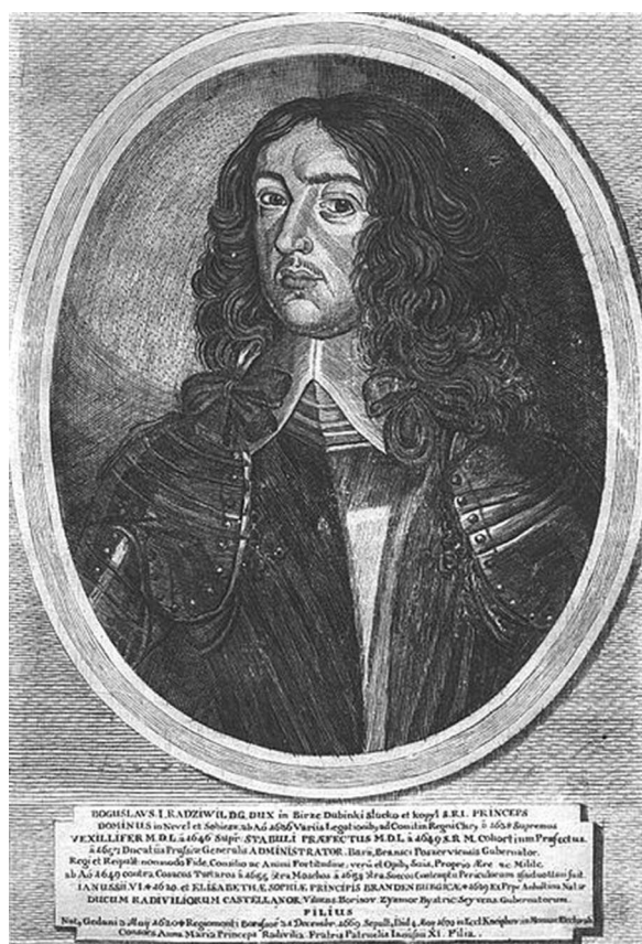
Fig. 6. Bogusław Radziwiłł, soțul Annei Maria Radziwiłł (după Leybowicz 1758).

neînsuflețit al soțului ei și cerea înapoierea bunurilor ei, conform registrului de înregistrare (registru) a averii lui Janusz Radziwiłł.