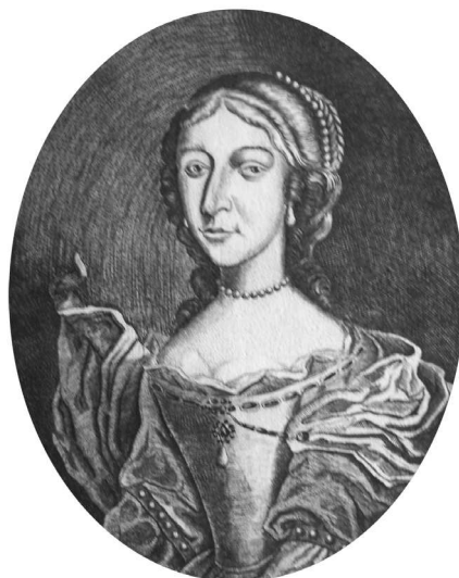
Fig. 7. Anna Maria Radziwiłł (după Leybowicz 1758).

După reîntoarcerea în Lituania, la 20 noiembrie 1659, la Liubecz, ea a scris un testament desfășurat și două acte separate, particulare pentru averea mănăstirii ortodoxe Înălțarea Maicii Domnului (Zaśnięcica), pentru 12 călugări și 150 000