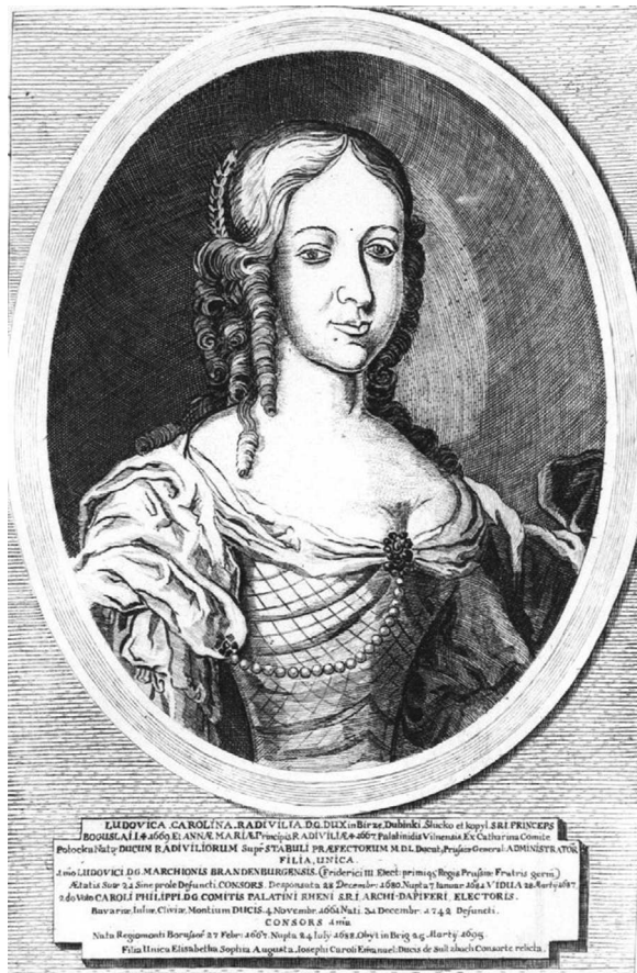
Fig. 9. Ludwika Karolina Radziwiłł (după Leybowicz 1758).

După moartea Mariei a început o luptă aprigă pentru averea ei succesorală și discuții (pertractare) în jurul testamentului.