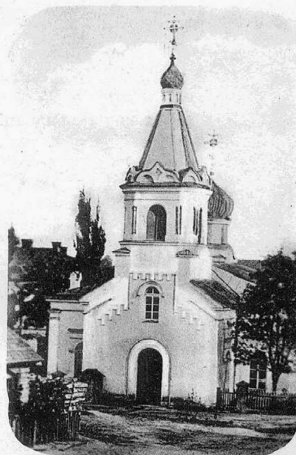
Каменная церковь во имя Преображения Господня.