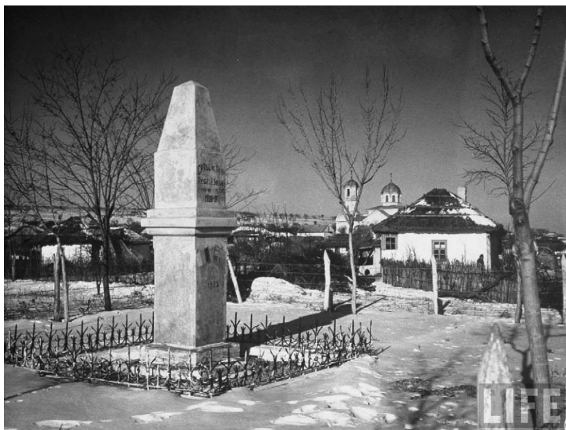
Fig. 2. Monumentul consacrat regelui suedez Carol al XII-lea de la Varnița, 1932.