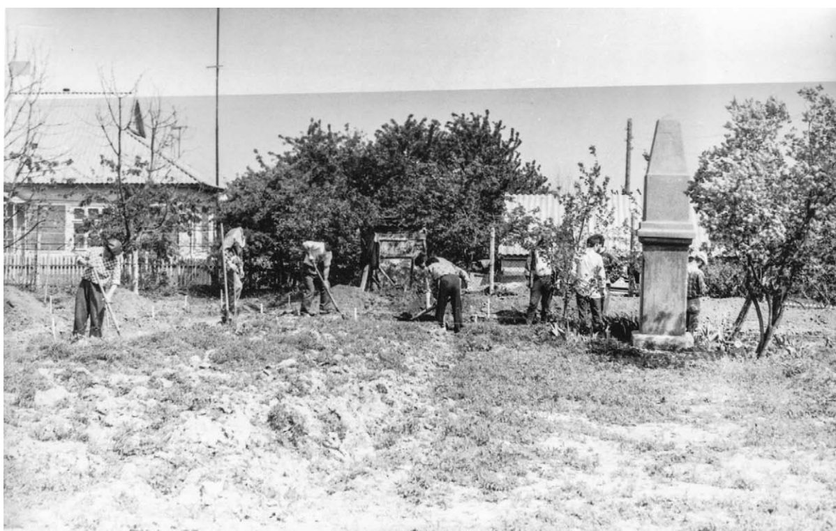
Fig. 4. Investigații arheologice la Varnița, realizate în spațiul fostei tabere a regelui suedez Carol al XII-lea, 1993.

de fier – cuie, scoabe. În apropierea clădirii a fost găsit un fragment de lulea care prin analogie, a fost datat cu secolele XVII-XVIII. Aceste vestigii și însuși faptul că clădirea a fost nimicită de foc, ne face să presupunem că este vorba de una din clădirile Taberei regelui Carol XII” 8 . Autorul Raportului mai subliniază că „colaboratorii muzeului au organizat și o expoziție fotodocumentară la Varnița, consacrată aflării regelui suedez Carol al XII-lea în Moldova (1709-1713) în casa achiziționată de Ministerul Culturii în toamna anului 1992. La 1 februarie 1993, expoziția a fost deschisă pentru vizitatori, înființându-se propriu-zis Muzeul memorial „Carol XII” ca filială a Muzeului Național de Istorie” 9 . Deși noul muzeu a fost numit memorial, trebuie să subliniem, că instituția nou-creată nu însuma toate criteriile de instituție memorială, existând doar locul memorial, unde cândva fusese Tabăra regelui suedez . Dar apariția muzeului însemna încă un efort în procesul muzeificării acestui sit istoric.