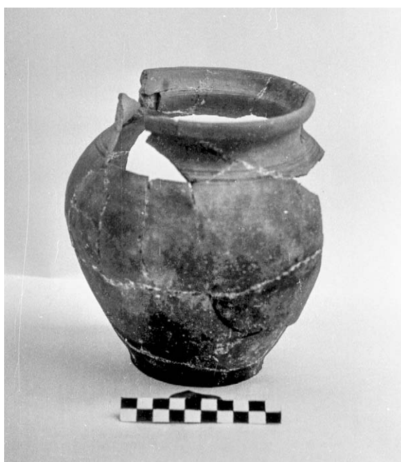
Fig. 5. Vas ceramic depistat în timpul investigațiilor arheologice de la Varnița din anul 1993.

un fel de rezerve pentru interpretarea construcției descoperite parțial, ca făcând parte din clădirile administrative ale taberei lui Carol XII, care a fost luată cu asalt de către turci și distrusă în rezultatul incendiului provocat de bombardament 10 .