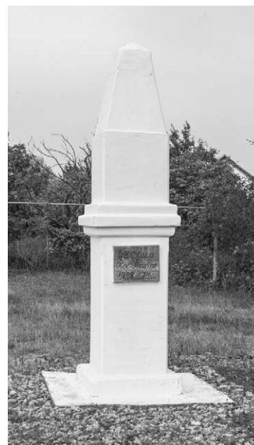
Fig. 3. Monumentul consacrat regelui suedez Carol al XII-lea de la Varnița, 2015.

localnicilor” 3 . Din Raportul lui V. Brătulescu reiese că la Varnița în perioada interbelică exista un monument consacrat lui I. Mazepa. Din păcate, cercetările noastre în arhive, pe această dimensiune nu ne-au oferit alte informații privind existența unui monument al lui I. Mazepa la Varnița. Ceea ce putem adăuga este faptul că o stelă consacrată lui I. Mazepa a fost instalată în spațiul sitului istoric Tabăra regelui suedez Carol al XII-lea de la Varnița la 25 septembrie 1999. Monumentul reprezintă un obelisc modest pe care este scris în limba ucraineană: „În acest loc, pe 22 august 1709, a decedat hatmanul Ucrainei Ivan Mazepa”. Este cunoscut faptul că I. Mazepa nu are nici o legătură cu Varnița, a murit nu la Varnița, ci la Bender. Se presupune că prima înmormântare a lui Mazepa a avut loc la Varnița. Conform dispoziției nepotului său Voinarovski, sicriul lui a fost dus la Galați, fiind înmormântat cu mare pompă în biserica „Sfântul Gheorghe”. Stela a fost instalată în legătura cu aniversarea a 290-a de la moartea hatmanului ucrainean de către Societatea de cultură ucraineană „Червона калина” din Tiraspol. Autorul stelei este arhitectul O. Napolski.